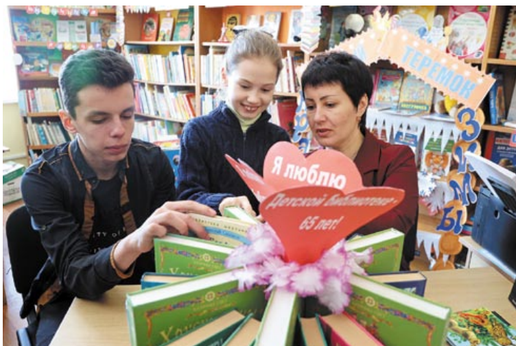
В Чаусской центральной районной библиотеке. 2021 год

В совокупности все перечисленные факторы ставят под вопрос экономическую целесообразность функционирования стационарных учреждений культуры в значительной части белорусских деревень и даже в отдельных районных центрах. Факт утраты социальной значимости сельских библиотек в последние годы стал очевидным для органов государственного управления, что нашло отражение в нормативно-правовой базе. Так, 14 декабря 2020 года внесены изменения и дополнения в постановление Совета Министров Республики Беларусь № 724 «О мерах по внедрению системы государственных социальных стандартов по обслуживанию населения республики». Документ закрепляет перечень условий (требований к объему и качеству услуг) в различных областях человеческой деятельности, необходимых для полноценного существования личности, выполнение которых гарантируется государством. Предыдущая редакция стандартов закрепляла необходимость наличия в каждом агрогородке республики (в 2020 году таковых в стране насчитывалось 1457) не менее одной библиотеки или организации культуры смешанного типа, осуществляющей вид культурно-просветительской деятельности, соответствующий основному виду деятельности библиотеки. Опираясь на данные факты, можно утверждать, что подавляющая часть сельских библиотек сегодня сосредоточена именно в агрогородках. Однако в целом по регионам страны стандарт не выполнялся. Например, по итогам первого полугодия