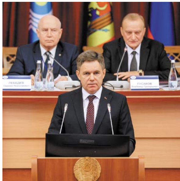
В работе Международной научно-практической конференции «30 лет Содружеству Независимых Государств: итоги, перспективы» принял участие заместитель премьер-министра Беларуси Игорь Петришенко

Будучи участником интеграционных структур разного уровня и осознавая преимущества каждого из них, наша страна нацелена на последовательную работу