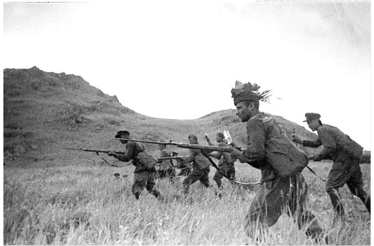
▲ Красноармейцы идут в атаку. 1938 год

Массовый героизм советских солдат не смог заслонить существенных просчетов в боевой подготовке войск КДФ. Это было отмечено в резолюции Главного военного совета РККА «О событиях у озера Хасан» от 31 августа 1938 года [14, с. 135–141], затем и в секретном приказе К. Ворошилова от 4 сентября 1938 года: «Боевая подготовка войск, штабов и командно-начальствующего состава фронта оказалась на недопустимо низком уровне... японцы были разбиты и выброшены за пределы нашей границы только благодаря боевому энтузиазму бойцов, младших командиров, среднего и старшего командно-политического состава, готовых жертвовать собой, защищая честь и неприкосновенность территории своей великой социалистической Родины...». В приказе также отмечены слишком большие для таких непродолжительных боев потери советских войск, которые «не могут быть