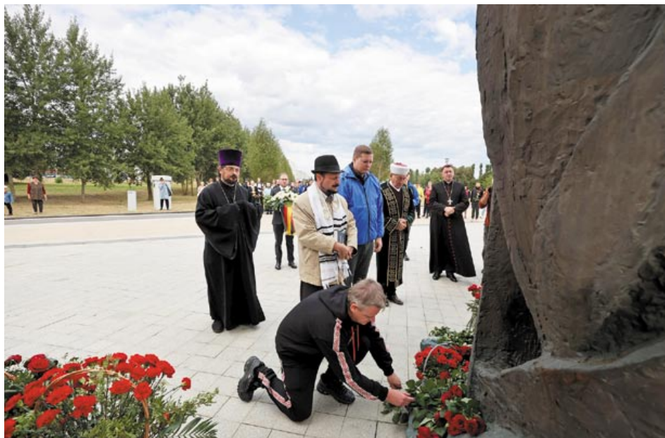
На Дні памяці ахвяр лагера смерці Трасцянец. 3 верасня 2022 года