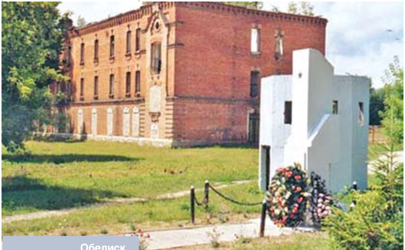
Обелиск, установленный на месте бывшего концлагеря в 1962 году. На заднем плане – здание, которое занимала лагерная администрация