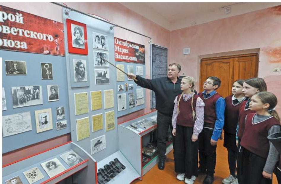
Люк от танка Т-34 «Боевая подруга», на котором воевала Мария Октябрьская, – главный экспонат музея в Крынках

Прах гвардии сержанта танковых войск Марии Васильевны Октябрьской захоронен у кремлевской стены, но не московской, а смоленской. Члены экипажа, провожая своего боевого друга в последний путь, поклялись ей, что будут воевать на «Боевой подруге» до самой победы. Но сохранить ее машину им не удалось.