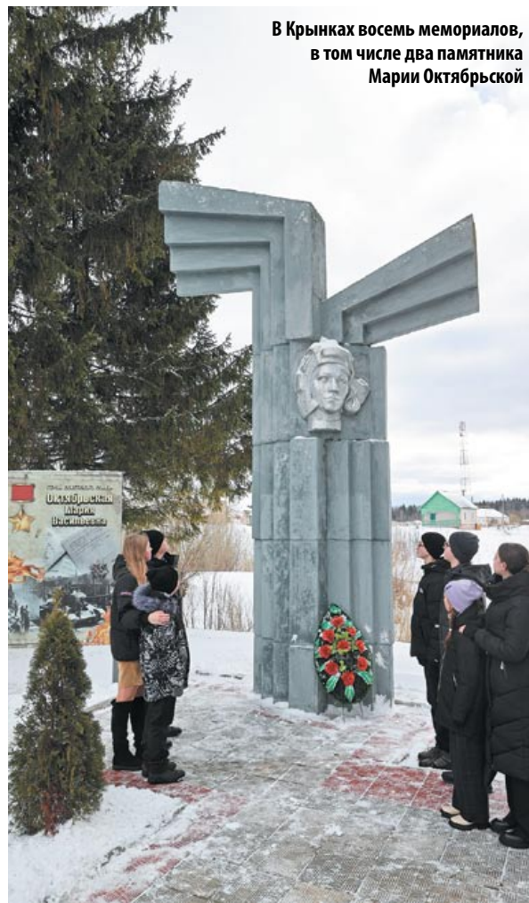
В Крынках восемь мемориалов, в том числе два памятника Марии Октябрьской