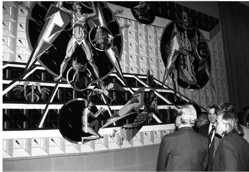
▲ У гобелена «Чернобыль», подаренного от имени народа и правительства Беларуси Организации Объединенных Наций в сентябре 1991 года