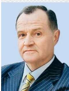
Петр КРАВЧЕНКО, министр иностранных дел Республики Беларусь (1990–1994), кандидат исторических наук

М ы находимся в Минске, где тысячи людей заполнили площадь Ленина на экологическом, «чернобыльском» митинге в связи с открытием I съезда народных депутатов СССР. На дворе май 1989 года, и я вот уже более 20 минут пробиваюсь к микрофону. Пробиваюсь сквозь стену ненависти, клеветы и оскорблений.