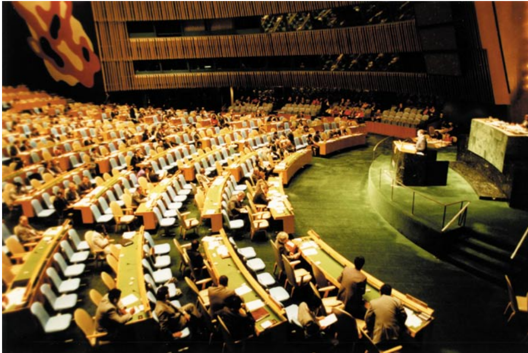
◀ Выступление министра иностранных дел Республики Беларусь П.К. Кравченко на 46-й сессии Генеральной ассамблеи ООН. Октябрь 1991 года

Помню тот необыкновенный подъем, страстное желание работать, что-то преодолеть, превозмочь, как можно быстрее добиться успеха. Хотелось сделать что-то полезное и конкретное для родной Беларуси, своего народа. Между тем обстановка вокруг еще рутинная, сонная. На мои попытки как-то оживить белорусскую дипломатию маститые дипломаты союзного МИД посматривают с нескрываемым удивлением и явным осуждением. Мол, а это еще зачем? Что, ему больше других надо? Чернобыльская трагедия? Зачем бередить и вспоминать эту неприятную историю? Ведь год назад сказали вскользь и забыли. К тому же есть установка М.С. Горбачева: не бередить старые раны, не просить помощи у Запада. Ведь будут же злословить: смотрите, великая страна, а стоит с протянутой рукой. Негоже. Надо, как говорят японцы, сохранять лицо. А то, что дети уже начинают умирать и за первых пять лет получено республикой только 5 млн долларов при ежегодной потребности в 75 млн долларов, необходимых для закупки лекарств и оборудования, это дело внутреннее, дипломатов оно не касается. В то же время Минатом-