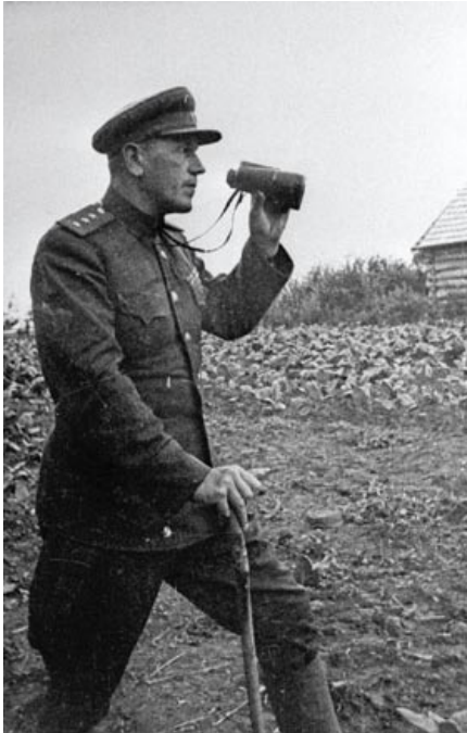
Камандуючы 3-й ударнай арміі генерал-палкоўнік Аляксандр Гарбатаў. 1943 год