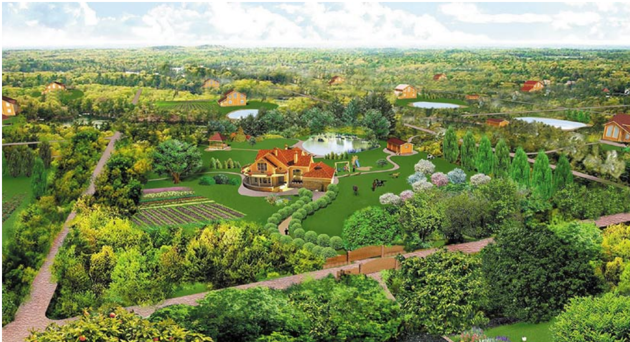
Рисунок 2. Образ поселения, состоящего из родовых поместий