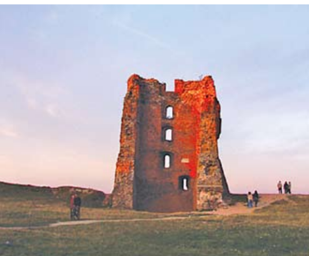
Лучшим памятником Миндовгу было бы укрепление стен Новогрудского замка

Меж тем руководитель крупной фирмы, работающей на литовском направлении, в начале 2009 года констатировал: «Прошедший 2008 год был одним из худших (если не самым худшим!) в истории белорусско-литовских туристических отношений. По сравнению с 2007 годом падение спроса на туры в Литву составило 40–50 %» [17]. Уточненные данные Министерства спорта и туризма дают еще более яркую картину: число организованных туристов, посетивших Литву в 2007 году, составило 27 764 человека, в 2008 году – 5 551 [18]. Причина очевидна: все дело в дорожной визе.