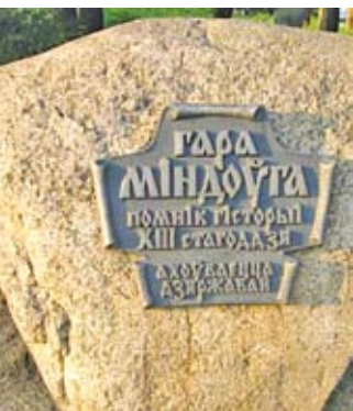
Легенда гласит, что здесь похоронен король

В 1040 году (или, по другим данным, в 1044-м) эту границу перейдет с войском киевский князь Ярослав, прозванный затем Мудрым, и заставит Литву платить дань Руси. Любопытно, меж тем, следующее: данное событие ныне отмечается как день рождения Новогрудка. После того, как в Вильнюсе отгремели торжества по поводу тысячелетия страны, в белорусском райцентре отметили праздник 965-летия. Правда, современная историческая наука ставит под сомнение появление Новогрудка на политической карте мира ранее XIII века. Считается, что в 1044 году Ярослав во время похода на Литву «заложил» (основал) Новогрудок. Так говорится в одной из хроник. Но в более раннем варианте летописи проясняется: «Ходи Ярослав на Литву; а на весну Володимирь заложи Новьгород и сдела его. В лето 6553 [= 1045]. Заложи Володимирь святую Софею в Новегороде». В переводе это значит, что один князь, киевский, ходил на Литву, а другой, новгородский (а не новогрудский), строил оборонительные укре-