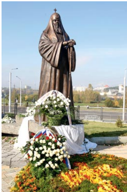
► Памятник Святейшему Патриарху Московскому и Всея Руси Алексию II в г. Минске

– Алексий II стал патриархом в нелегкое время – в период распада единого советского государства, но, несмотря на это, ему удалось сохранить православную церковь, – говорит протоиерей Ф. Повный. – Он также сыграл огромную роль в процессе возвращения храмов верующим, их восстановлению и возведению новых церквей. Беларусь Святейший Патриарх посещал шесть раз и всегда тепло отзывался о нашей стране. Он побывал во многих белорусских епархиях и, по большому счету, духовно зашел в дом к каждому белорусу. В 1991 году патриарх освятил закладку фундамента нашего Всехсвятского храма. В октябре 2008 года, за месяц до своей кончины, он посетил нашу тогда еще недостроенную до конца святыню. Несмотря на незавершенность строительного процесса, он был вдохновлен увиденным и затем щедро делился этим вдохновением с нами. Все говорило о том, что наш храм патриарху не просто