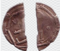
Резана из дирхама Аббасидского халифата