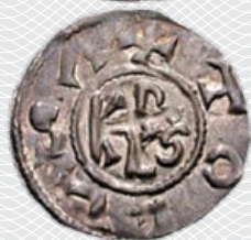
Денарий (куна) Карла Великого