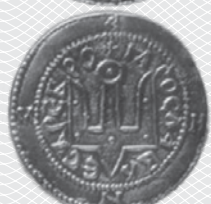
Новгородский сребреник Ярослава Мудрого. XI век

◀ Новгородская гривна из селища в районе Копорья. Ленинградская область