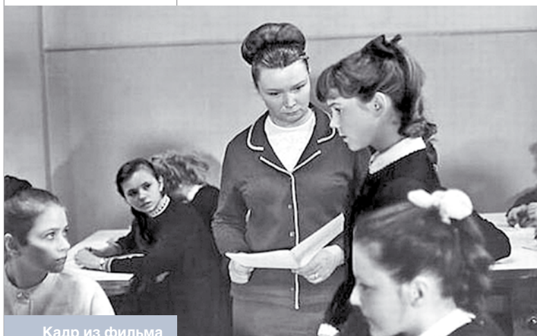
Кадр из фильма «Доживем до понедельника»

Наряду с перечисленными портретами «типичной училки» стоит отметить восприятие, характерное для молодых респондентов: «хорошо выглядит» – аккуратная короткая стрижка, строгий деловой костюм, умеренный макияж, средний возраст. Подобное описание соответствует имиджу современной деловой женщины: администратора, менеджера и т.п. Мало-