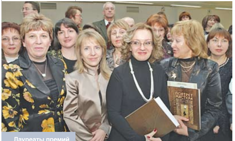
Лауреаты премий Мингорисполкома педагогам учреж- дений образования столицы

Вместе с политическими, социально-культурными изменениями в обществе менялся и образ учителя, его базовые и сопутствующие характеристики. Так, если в XIX веке учитель – это мужчина, возможно иностранец или же студент, зарабатывающий «уроками», то в XX веке это, прежде всего, женщина.