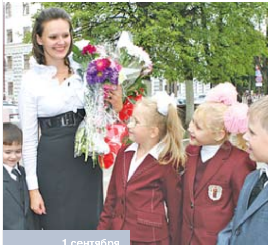
1 сентября в столичной средней школе № 4

Помимо привычных учитель, учительница, преподаватель , обширно представлены номинации, указывающие на специализацию (стилистически нейтральные и окрашенные): учительница русского языка, русица, словесница, русачка, русалка, филологица (-ня) и т.д.; характеризующие ЛКТ по месту работы: учитель в воскресной / в первобытной школе, сельский / городской учитель ; по характеру занимаемой должности: классный руководитель, директор, завуч ; по продолжительности работы в определенной школе: старая / новая учительница .