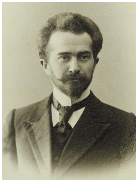
Николай Онуприевич Лосский