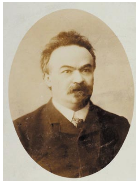
Николай Максимович Минский (Виленкин), участник полемики вокруг сборника «Вехи»

Следует отметить, что в конце XIX – начале XX века самым востребованным факультетом в российских университетах был юридический. При этом правовой нигилизм, отсутствие уважения к праву были нормой среди русской революционной интеллигенции. После 1917 года А.С. Изгоев, возвращаясь к поднятым в «Вехах» проблемам, писал «...о неуважении к праву и отсутствии правового чувства у русской интеллигенции, в особенности у большевиков, полностью отринувших право в политике и упразднивших его в повседневной жизни» [4, с. 18]. И здесь интересно мнение о перспективах преодоления правового нигилизма, высказанное в период полемики профессором, юристом и марксистом, близким к большевикам, М.А. Рейснером. Он отмечал