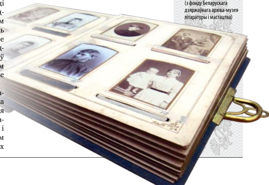
▼ Фотаальбом сям’і Багдановічаў