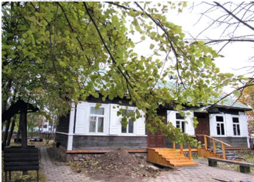
▼ Музей Максіма Багдановіча «Беларуская хатка» у Мінску (на стадыі рамонту)

Як і Максім Багдановіч, Аляксандр Блешчык вучыў мову продкаў самастойна, у вольны час. Лягчэй было толькі таму, што ў яго былі і падручнікі, і дапамога інтэрнэт-рэсурсаў. А не так даўно Аляксандр Блешчык разам з аднадумцамі адкрыў на базе адной з екацярынбургскіх бібліятэк шко-