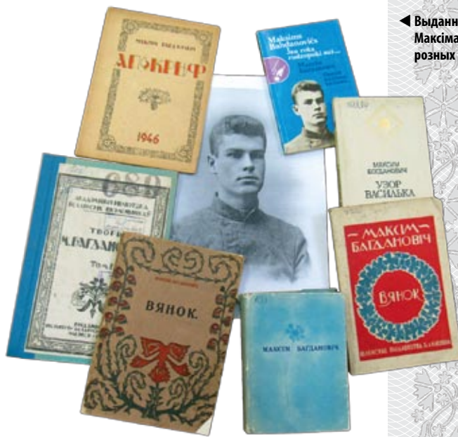
◀ Выданні твораў Максіма Багдановіча розных гадоў

Акрамя таго, у бібліятэцы ўніверсітэта г. Браціслава (Славакія) Мікола Валянцінавіч знайшоў брашуру «Беларускае адраджэнне» на ўкраінскай мове, выдадзеную ў 1916 годзе ў Вене. Гэты артыкул Максіма Багдановіча быў цалкам прысвечаны беларускай літаратуры. Прыемна, што ён аказаўся цікавым не толькі беларусам і паслужыў папулярызаванні нашай нацыянальнай культуры.