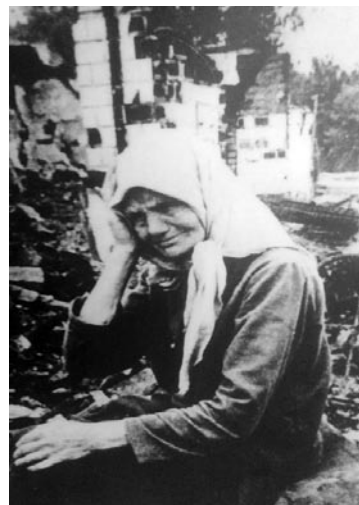
Лжепартизаны занимались мародерством, сжигали деревни, убивали людей

соединений Минской области майора Жукова: «Своей гнусной работой [бандиты] проповедовали, что грабят только партизаны. У населения сложилось мнение, что партизаны грабители, ибо эта группа действовала от имени партизан». В ноябре деятельность группы была пресечена.