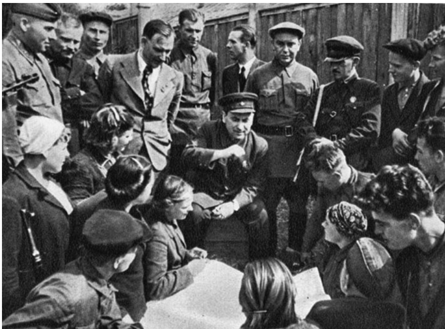
Начальник Центрального штаба партизанского движения П.К. Пономаренко среди витебских и могилевских партизан. Москва. Июль 1942 года