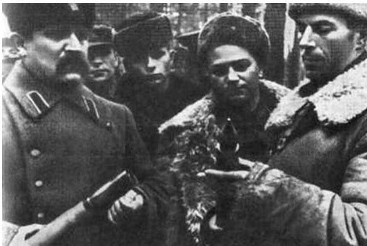
Народные мстители отряда специального назначения «Митя» уничтожили три банды лжепартизан. На снимке: командование отряда. 1943 год