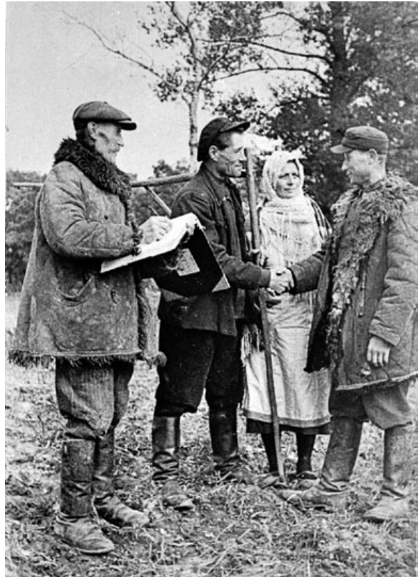
Прадстаўнік савецкай ўлады на вызваленай тэрыторыі віншуе сялян з атрыманнем зямлі, якая раней належала пану. 1939 год

Гісторыкі схіляюцца да думкі, што вызваленчы паход Чырвонай арміі, які пачаўся 17 верасня 1939 года і прывёў да ўз'яднання беларускага народа, стаў адначасова доўгачаканай і неспадзяванай падзеяй для насельніцтва Заходняй Беларусі. Не забываем, што нападам Германіі на Польшчу 1 верасня пачалася Другая сусветная вайна. Усё паказвала на тое, што марудзіць нельга.