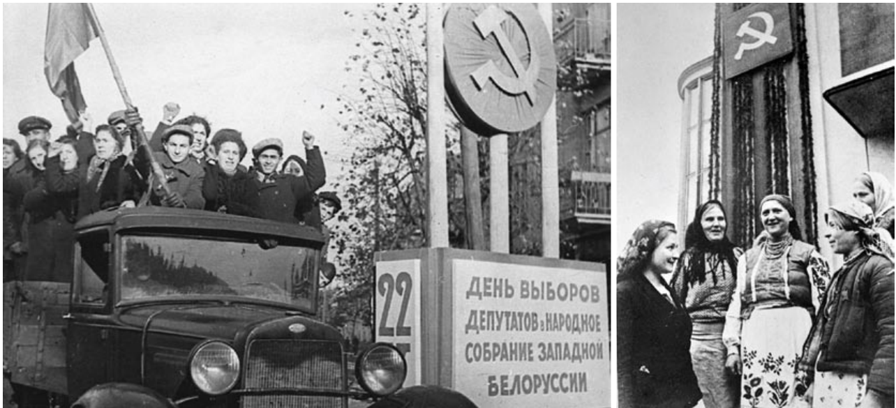
Народны сход Заходняй Беларусі напрыканцы кастрычніка 1939 года ў Беластоку заканадаўча замацаваў уваходжанне тэрыторый Заходняй Беларусі ў склад БССР

Беластоку, які напрыканцы кастрычніка 1939 года заканадаўча замацаваў уваходжанне тэрыторый Заходняй Беларусі ў склад БССР.