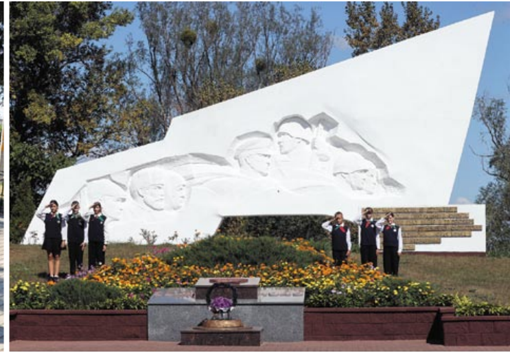
Манумент воінам-вызваліцелям на беразе Дняпра адкрылі ў 1976 годзе

– Трэба адзначыць, што з пачаткам вызвалення Беларусі пачалося непасрэднае тактычнае ўзаемадзеянне Чырвонай арміі і партызан, – адзначае прафесар Літвін. – Цэнтрам каардынацыі, планавання і выкарыстання партызанскіх сіл сталі ваенна-аператыўныя групы пры франтах. Пры вызваленні Камарына мясцовыя народныя мсціўцы дапамагалі зачысчаць плацдарм для пераправы. Ці згадаем магутны «Канцэрт» увосень 1943 года – другі этап рэйкавай вайны, красамоўны прыклад аператыўна-тактычнага ўзаемадзеяння партызан з часцямі Чырвонай арміі пры вызваленні Беларусі. Гэта мела працяг у далейшых аперацыях у студзені – лютым і летам 1944 года.