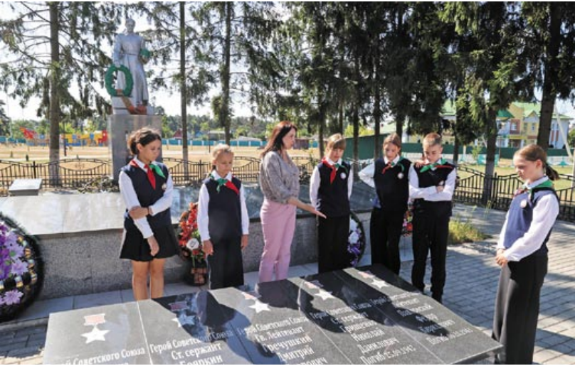
Ля брацкай магілы ў Камарыне