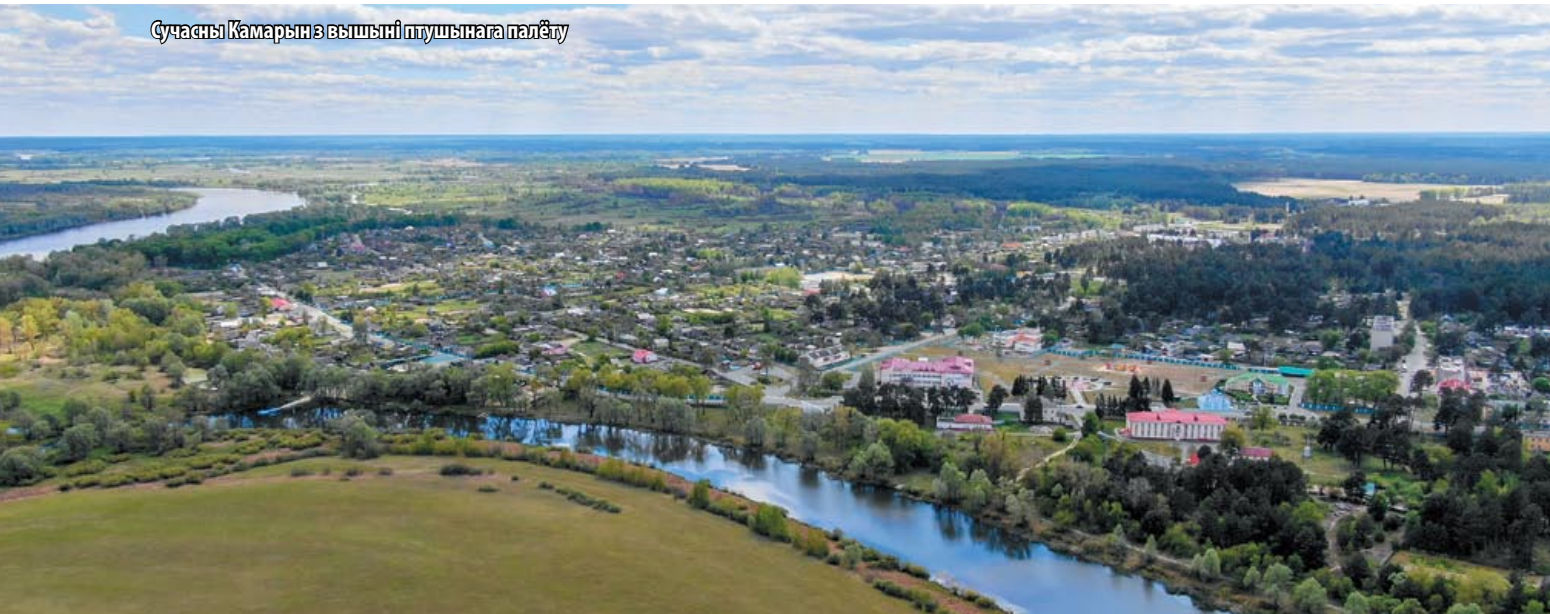
Сучасны Камарын з вышэйняй птушынага палёту

На алеі Славы ў пасёлку, па якой штодня крочаць вучні мясцовай школы, партрэты 20 чырвонаармейцаў і камандзіраў, якія атрымалі званне Героя Савецкага Саюза за фарсіраванне Дняпра ў раёне Камарына.