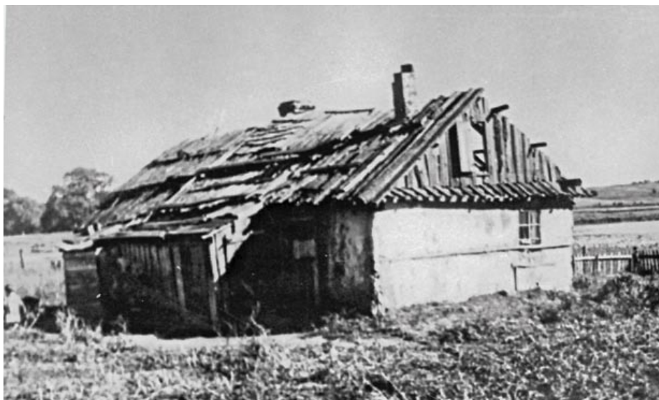
Хата селяніна-бедняка ў ваколіцах Глыбоччыны, якая да верасня 1939 года ўваходзіла ў склад Польшчы. Сярэдзіна 1930-х гадоў