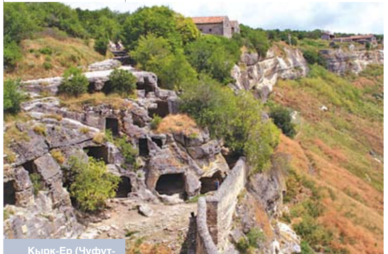
Кырк-Ер (Чуфут-Кале) – сталіца Хаджы-Гірэя. Сучасны выгляд

ў 1450-я гады літоўскай арыстакратыяй нібыта планавалася змова з мэтай звяржэння вялікага князя Казіміра, ажыццяўленню якой перашкодзіў Хаджы-Гірэй [2, б]. У гэты ж час (1452 год) Хаджы-Гірэй канчаткова разбіў Саід-Ахмета, які ўчыніў набег на львоўскую зямлю. Пасля паражэння Саід-Ахмет разам з прыбліжанымі ўцёк у Літву. Там ён быў злоўлены літоўцамі і пасаджаны ў замак у Коўне, дзе і памёр [27, с. 110–111].