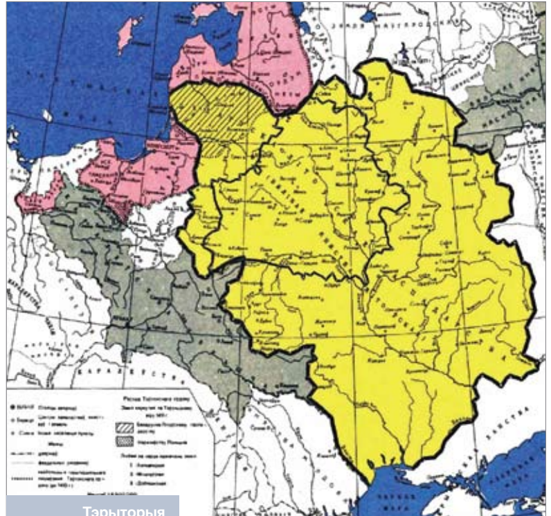
Тэрыторыя Вялікага княства Літоўскага пры Вітаўце (пачатак XV стагоддзя)

Кадыр-Берды быў апошнім сынам Тахтамышы, які прэтэндаваў на ўладу ва ўсёй Залатой Ардзе. Са смерцю Едыгея, пры якім Залатая Арда была больш-менш адзінай дзяржавай, міжусобная вайна розных прэтэндэнтаў на ханскі трон толькі ўзмацнілася. Аднак гэта не спыніла Вітаўта. ВКЛ да таго часу вельмі пашырыла свае межы, якія даходзілі да Чорнага мора. Апроч літоўскай гавані Хаджы-бей (Адэсы), ВКЛ мела ад татараў замкі каля Дняпра: Крамянчуг, Упск, Місурын, Гербедзеў Рог, Тавань, Баргун, Цягін (Бяндэры) і Ачакаў, якія служылі перашкодай для ордаў, што вандравалі з боку Дона [22, с. 9].