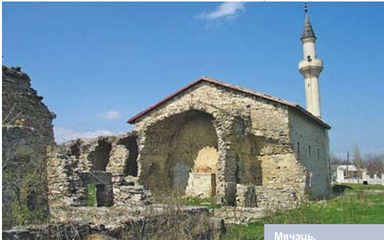
Мячэць, пабудаваная пры хане Узбеку (XIV стагоддзе). г. Стары Крым

жа 1425 годзе хан Худайдат з’явіўся ў раёне літоўскіх межаў і рушыў на Разанскае княства, якое знаходзілася ў гэты час пад уладай Вітаўта. «І тады нашы князі, баяры і людзі, якія жывуць на мяжы, сабраліся і пайшлі за ханам. І нагналі яго, біліся з ім у разанскай зямлі і выйгралі бітву, без вялікіх страт» [15, с. 688]. Верагодна, гэта паражэнне канчаткова аслабіла сілы Худайдата, і ён быў вымушаны адступіць назад ва ўсходнія ўлусы. У сваю чаргу, гэта дало магчымасць Улуг-Мухамеду аднавіць сваю ўладу на тэрыторыі заходніх улусаў,