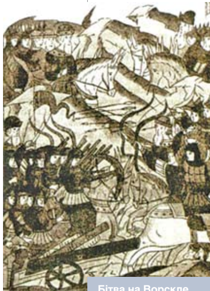
Бітва на Ворскле. Мініяцюра XVI стагоддзя

Дамоўленасць паміж Вітаўтам і Тахтамышам, хоць і выгадная для абодвух бакоў, была, аднак, цяжка здзяйсняльная. Цемір-Кутлуг, які валодаў Залатой Ардой, зусім не збіраўся саступаць трон Тахтамышу і запатрабаваў у Вітаўта выдчы ўцекача. Вітаўт адмовіў. У 1399 годзе на р. Ворскле адбылася бітва са стаўленікамі Тамерлана Цімур-Кутлугам і эмірам Едыгеем, вынікам стала поўнае паражэнне войскаў Вітаўта і Тахтамышы. Застаючыся ў Літве, Тахтамыш спрабаваў памірыцца з Тамерланам, аднак безвынікова. Неўзабаве пасля бітвы на р. Ворскле памёр Цімур-Кутлуг, і ўлада перайшла ў рукі эміра Едыгея, які яшчэ пры жыцці Цімур-Кутлуга быў «князем над всеми князьями в орде». ВКЛ было аслаблена, і Вітаўт больш не мог аказваць падтрымку Тахтамышу. Тады апошні перабраўся ў Сібір і змог заснаваць там дастаткова вялікі ўлус. Характэрна, што Тахтамыш да 1405 года змог змірыцца з Тамерланам, і апошні