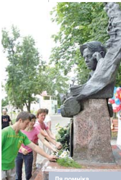
Ля помніка Уладзіміру Караткевічу ў Оршы

Для выкрыцця адмоўных грамадскіх з’яў і памылковых уяўленняў У. Караткевіч удала выкарыстоўваў магчымасці гротэску, сарказму і іроніі. У раманах «Хрыстос прыямліўся ў Гародні» прадстаўнікі касцёла і царквы судзяць мышэй. Паводле іх аб-