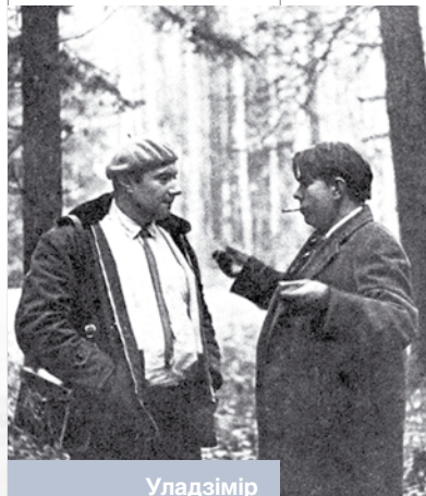
Уладзімір Калеснік і Уладзімір Караткевіч у Белавежскай пушчы. 1971 год

не быў выключэннем з правіла. Звычайна мы мучаем тую, якую кахаем, а самі мучымся яшчэ больш ад розных супярэчлівых думак, пытанняў, учынкаў, якія іншымі вельмі лёгка прыводзяцца да аднаго знамянальніка» [1, т. 7, с. 123]. Такім чынам, нацыянальная гісторыя і неабсяжны свет кахання з'яўляліся для У. Караткевіча невычэрпнымі крыніцамі творчай фантазіі.