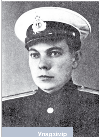
Уладзімір Караткевіч у час праходжання афіцэрскіх збораў на Ціхаакіянскім флоце. 1965 год

Пісьменнік стварыў бліскучую панара-му падзей пачатку XVI стагоддзя, у якой за-фіксаваў сутнасць эпохі, галоўныя ідэйныя канфлікты часу: «У той год Рым анафемства-ваў Лютэра і ўсіх, хто з ім, успамінаў пра-клёнам Арыя, Вальдэнса, чарнакніжніка Агрыпу, Гуса і Героніма Пражскага і іншых ерэсіярхаў. У той год Масква ўспамінала анафемай Святаполка Акаяннага і ноўгарад-скіх «жыдоўствуючых», якія адмаўлялі мана-стыры і царкоўнае землеўладанне і казалі, што Хрыстос і без біскупа ёсць Хрыстос, а біскуп без Хрыста – тфу, і нашто ён тады ўвогуле?» [1, т. 6, с. 61].