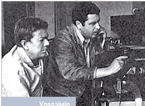
Уладзімір Караткевіч у час працы над фільмам «Дзікае паляванне караля Стаха» на кінастудыі Беларусьфільм. 1979 год

Вельмі дарагі для У. Караткевіча вобраз Васіля Вашчылы, які з'яўляецца цэнтральнай фігурай п'есы «Маці ўрагану». Пачынаючы ўзброеную барацьбу, Васіль Вашчыла выразна ўсведамляе, што паўстанне можа быць жорстка задушана. Але ён гатовы загінуць, чымся далей зносіць здзекі, страшэнны прымус і катаванні: «Ды лепей паступіцца жыццём, чым сумленнем. Ведаю, справа толькі ў часе. Можна, мы не пратрымаемся і месяца, можа нас хопіць на