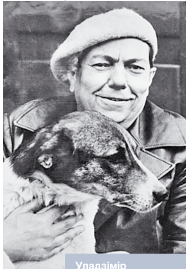
Уладзімір Караткевіч. 1980 год

Творы У. Караткевіча вельмі густа засеяны дасціпнай народнай лапанкай, незлаблівымі знявагамі, сваркамі і спрэчкамі герояў, сакавітымі праклёнамі і пагрозамі, што стварала камічны эффект, дазваляла праўдзіва і рэалістычна выявіць сутнасць характараў і вобразаў.