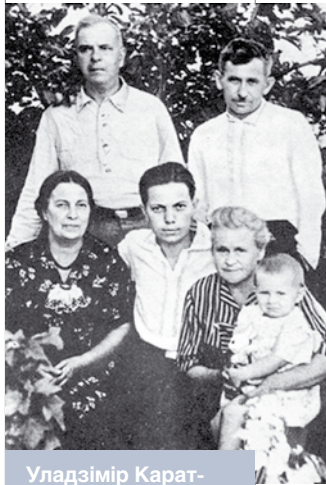
Уладзімір Караткевіч з бацькамі і роднымі пасля заканчэння Кіеўскага дзяржаўнага ўніверсітэта імя Т. Шаўчэнкі. Орша, 1955 год

Пісьменнік выказваў занепакоенасць тым, што зло на зямлі не знішчана дарэшты. Аповесць «Дзікае паляванне караля Стаха» ён скончыў словамі, у якіх гучала трывога за будучыню зямлі: «У жахлівым маўчанні шалёна скача над зямлёю дзікае паляванне караля Стаха. Я прачынаюся і думаю, што не прайшоў ягоны час, пакуль ёсць цемра,