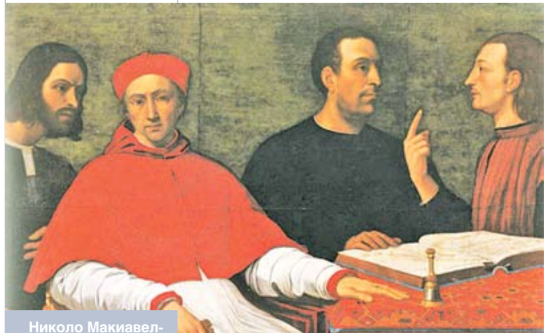
Николо Макиавелли (второй справа) беседует с Цезаре Борджиа, кардиналом Педро Луисом де Борха и его секретарем Мичеллетто Кореллой. Фрагмент картины Себастьяно дель Пьомбо, 1516 год

специфично, что во многом определяется местом и ролью институциональных факторов в той или иной сфере. Функционирование политики во многом определяется такими институтами, как государство, власть, партии и другие политические объединения и структуры. Что же касается моральных норм, то они формируются в самой практике массового поведения, в процессе взаимного общения людей и находят отражение непосредственно в коллективных и индивидуальных представлениях, чувствах и воле. «Моральные нормы воспроизводятся повседневно силой массовых привычек, велений и оценок общественного мнения, воспитываемых в индивиде убеждений и побуждений» [7, с. 517].