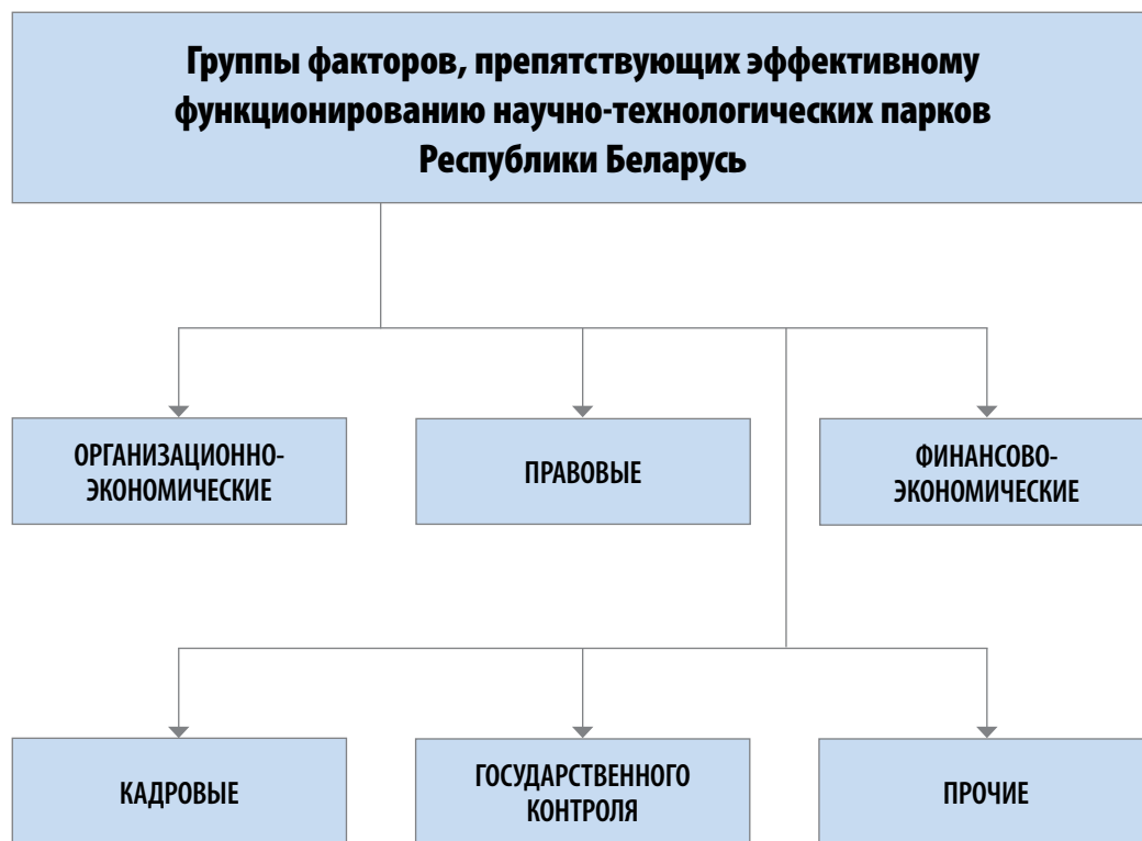
► Рисунок 1. Группы факторов, препятствующих эффективному функционированию технопарков Республики Беларусь Источник: разработка автора.

сения организаций Республики Беларусь к технопаркам;