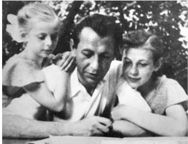
▲ Петр Машеров с дочками