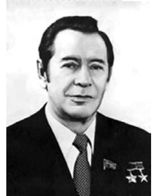
▲ Петр Миронович Машеров

В разговорах с секретарями ЦК КПБ Машеров открыто критиковал генсека за бездействие, которое все глубже погружало