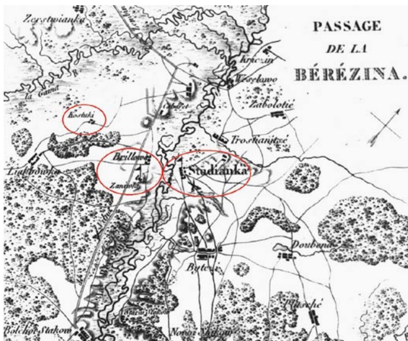
Фрагмент карты «Березинская переправа» авторства П.-Ж. Ламо. 1820-е годы. Красным отмечены участки поисковых работ экспедиции 1960 года

Согласно акту приема предметов № 260 от августа 1960 года, в музей поступили все 48 находок (№ КП 2964–2996) [15; 13, с. 65]. При работе с актом и детальном подсчете артефактов мы выяснили, что поступивших предметов было 47. В акте № КП 2976 пропущен, т. е. он не закреплен за каким-либо предметом. Возможно, одна из находок была посчитана