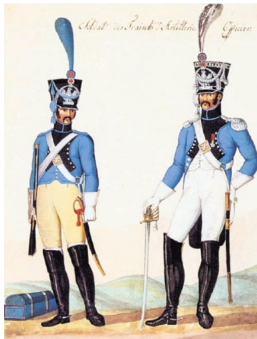
К.В. Кольб. Солдат и офицер артиллерийского обоза. 1807 год. Библиотека Браунского университета в Провиденсе

Концентрация и разнообразие найденного бутонистического материала свидетельствуют о скоплении войск и нагромождении обозов в районе переправы. Возможно при раскопках на позициях Великой армии экспедиция наткнулась на места биваков, устроенных 26–29 ноября боеспособными частями и некомбатантами (гражданскими лицами при армии), а также оставившими строй солдатами. О бедственном положении на биваках 28 ноября французский офицер Э. Лабом из 4-го (итальянского) корпуса писал: «Яростный ветер засыпал нам лицо обледенелым снегом. Большая часть офицеров, боясь замерзнуть и простудиться, не переставая бегали или ходили, стуча ногой об ногу. Ко всем несчастьям, так трудно было найти дров, что едва могли зажечь костер вице-королю (Эжену Богарне. – Авт.), и, чтобы достать горящую головню, пришлось напомнить баварским солдатам, что принц Эжен женат на сестре их короля!» [23, с. 374].