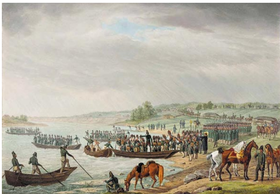
А. Адам. Переправа итальянского корпуса Э. Богарне через Неман 30 июня 1812 года. 1815–1825 годы. Государственный Эрмитаж в Санкт-Петербурге