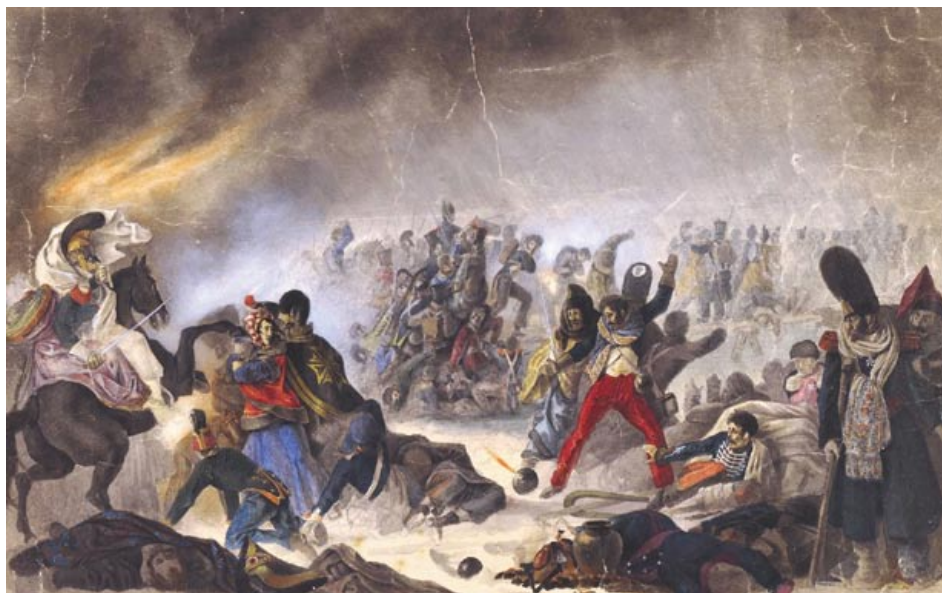
Х.В. Фабер дю Фор. Переправа через Березину. 1812–1816 годы. Баварский музей армии в Ингольштадте