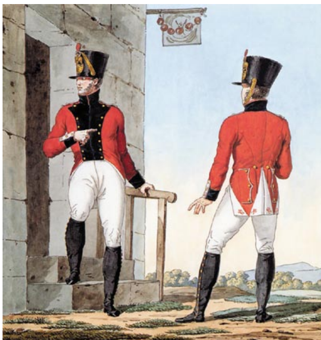
К. Верне. 3-й швейцарский полк. 1812 год. Музей армии в Париже

Кроме пуговиц с обмундирования армейских подразделений, имеются мундирные пуговицы гвардейских частей. Например, малая пуговица униформы одного из полков пехоты или тяжелой кавалерии знаменитой французской Императорской гвардии (№ КП 2970), которая не принимала участия в сражениях на Березине, оставаясь в резерве при ставке Наполеона. Характерная особенность пуговиц с обмундирования этих воинских формирований – штампованное изображение императорского орла, смотрящего вправо. Еще одна пуговица (большая, № КП 2971) – к униформе одного из пехотных формирований Итальянской королевской гвардии, входившей в 1812 году в состав 4-го корпуса