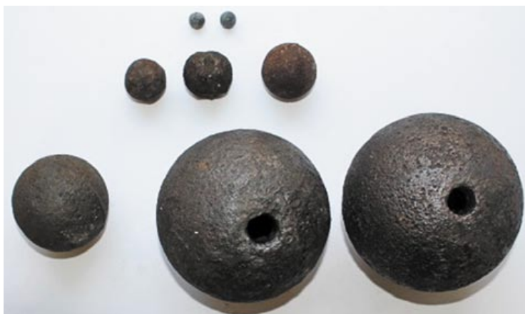
Боеприпасы: верхний ряд – пули, второй ряд – дальняя картечь, нижний ряд – ядро и гранаты

Другая группа находок – пять монет, обнаруженных там же, где и пуговицы. Солдаты и офицеры многонациональной Великой армии имели при себе массу различных монет. Среди находок есть серебряные прусские монеты номиналом 1/12 талера выпуска 1767–1768 и 1783 годов (№ КП 2977–2979). Скорее всего, они принадлежали личному составу немецких (или польских) контингентов Великой армии, поскольку союзные Франции прусские войска находились в ноябре 1812 года на другом участке боевых действий. Кроме прусских имеются монеты и российского происхождения: серебряная монета номиналом 15 копеек периода правления Екатерины II (№ КП 2981) и медная деньга выпуска 1744 года (№ КП 2980). Медные монеты не имели ценности для Великой армии, известно, что ими при отступлении из Москвы даже заряжали пушки вместо картечи [24, с. 52]. Видимо, эти монеты принадлежали одному из солдат или офицеров российской армии.