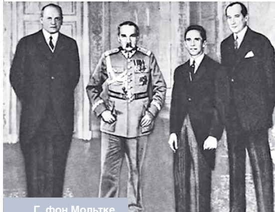
Г. фон Мольтке, Ю. Пилсудский, Й. Геббельс и Ю. Бек в Варшаве, 14 июня 1934 года

Попытка сравнить жизнь двух Иосифов XX века, скорее всего, вызовет раздражение как поклонников Пилсудского, так и последователей Сталина. Но сделана она не для того, чтобы показать, кто из них был лучше или хуже. Речь о другом. О том, что оба Иосифа были политиками, лишеными комплекса сомнений, действовавшими любимыми методами, подходящими, по их мнению, для достижения поставленных целей. И в этом тоже их сходство. В остальном они были антиподами, а в целом – даже врагами. ▀