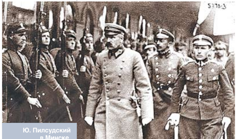
Ю. Пилсудский в Минске. 18 сентября 1919 года

Поворот Пилсудского в сторону Гитлера во многом объясняется тем, как маршал оценивал самого фюрера. Он исходил из того, что Гитлер является австрийцем, а менталитет австрийцев и немцев сильно от-