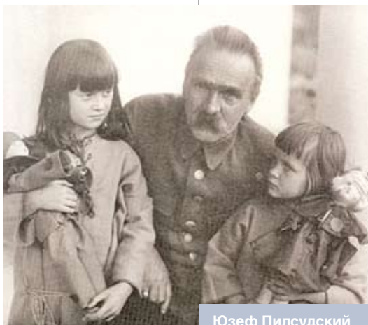
Юзеф Пилсудский с дочерьми