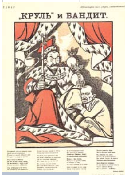
Советская листовка с сатирическими стихами Демьяна Бедного о Ю. Пилсудском и Б. Савинкове. 1922 год

Но оккупация гитлеровцами Чехии, справедливо подчеркнул Я. Цялович, означала нечто большее, чем исчезновение одного из государств: она со всей очевидностью засвидетельствовала, что ситуация в Европе неуклонно движется к войне. Это поняли в большинстве европейских столиц. Кроме Варшавы. Потому, когда спохватившаяся Великобритания предложила вместе с Францией, СССР и Польшей дать гарантии всем европейским государствам, то и «эта инициатива сошла на нет из-за позиции Польши». Так был упущен последний шанс уберечь мир, констатирует Я. Цялович и формулирует еще одну весьма важную мысль: после этого в