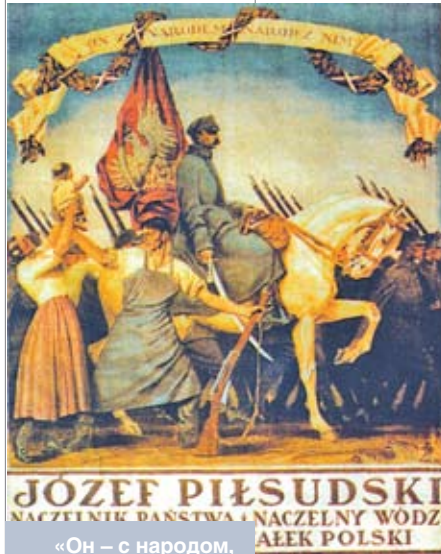
«Он – с народом, народ – с ним. Юзеф Пилсудский – глава государства и главнокомандующий, первый маршал Польши». Плакат 1920-х годов