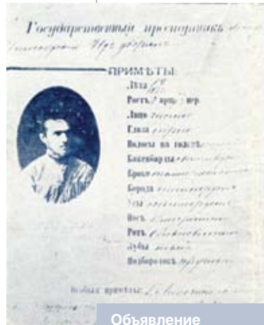
Объявление о розыске государственного преступника Иосифа Пилсудского. 1887 год

Генерал Вейган: «Маршал является жестким и завистливым по отношению к своей власти...»