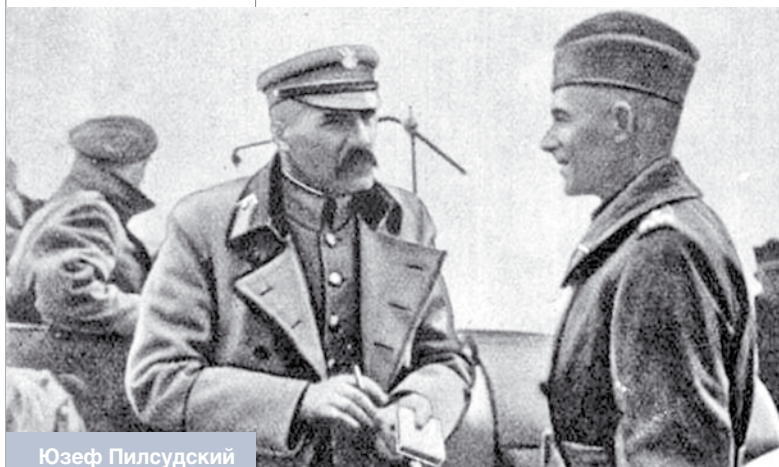
Юзеф Пилсудский и Эдвард Рыдз-Смиглы – будущий маршал Польши и верховный главнокомандующий. 1920 год

После смерти Пилсудского в 1935 году политику балансирования между Германией и СССР министр иностранных дел Польши полковник Бек дополнил элементами балансирования между Германией и Францией. В 1936 году Польша выступила против введения санкций в отношении оккупировавшей Абиссинию Италии, заявив устами Бека, что такого государства, как Абиссиния, не существует. Она даже полусловом не осудила Германию за аншлюс Австрии, сама приняла активное участие в растерзании Чехословакии – тоже союзницы Франции. Сделанный Пилсудским поворот Польши в сторону сотрудничества с