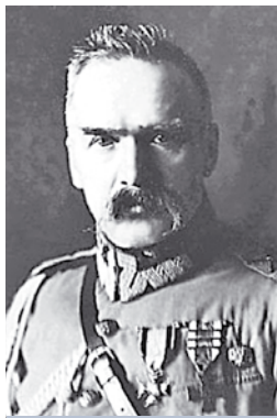
Юзеф Клеменс Пилсудский