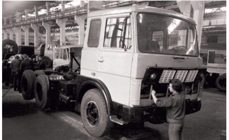
▲ Сборка МАЗ-6422 в экспериментальном цехе. 1981 год