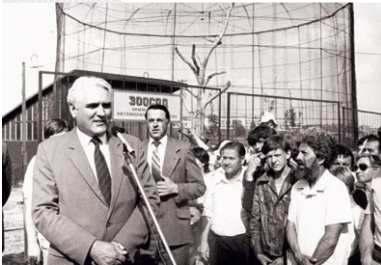
▼ Открытие зоосада в Минске. 1984 год

Конец шестидесятых – время создания нового типа машин, которых не то что в СССР, в мире никто не делал. Стране нужен был тягач огромной грузоподъемности и проходимости для установки новых ракет стратегического назначения. Предполага-