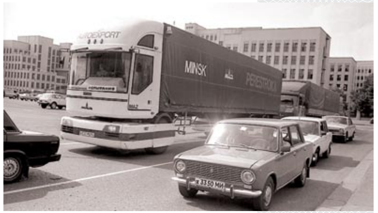
▼ Идут испытания МАЗа «Перестройка»