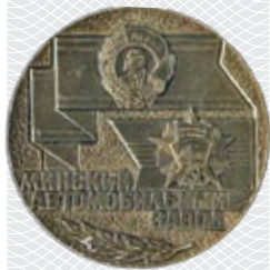
▲ Памятная медаль МАЗа (лицевая и оборотная стороны)