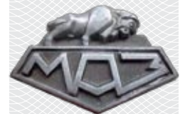
▲ Эмблема МАЗа