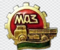
▲ Нагрудный знак МАЗа

И тогда Лавриновича придумал «подправить ненужную строку в тех директивах на новую пятилетку – и тут же, словно по взмаху волшебной палочки, пойдут ресурсы...». Вместе с Высоцким он поехал в Москву. В Госплане, в отделе машиностроения, Лавринович обратился к Юрию Чуприкову, заведующему сектором, который курировал Минский автозавод. Понимающий чиновник поддержал идею. На второй день подкорректировали документ, вместо выпуска старых машин «поручили» минским автозаводам перейти на производство новых, трехосевых автомобилей грузоподъ-