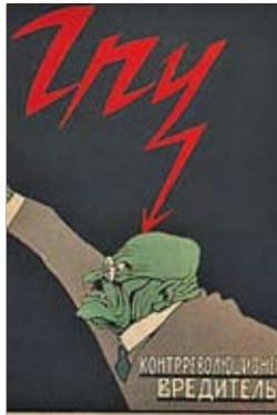
Савецкі плакат (фрагмент). Пачатак 1930-х гадоў