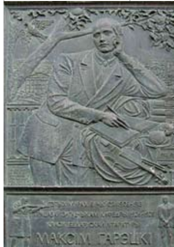
Мемарыяльная дошка, прысвечаная Максіму Гарэцкаму, на сцяне корпуса № 4 сельскагаспадарчай акадэміі ў г. Горкі Магілёўскай вобласці

Прежде всего, мы старались овладеть просвещением для организации белорусских школ. Тогда была открыта первая белорусская гимназия в Минску по б. Александровской улице, а таксама первые белорусские учительские курсы. Потом орга-