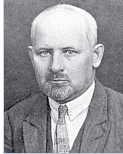
Вацлаў Юстынавіч Ластоўскі

У сувязі з гэтым хацелася б звярнуцца да яшчэ адной крымінальнай справы з Цэнтральнага архіва КДБ. Гэта так званае «Уголовное дело по обвинению Ластовского Вацлава Устиновича и др.» пад нумарам 20951-С у 29 тамах, больш вядомае ў навуковай літаратуры як «справа Вацлава Ластоўскага» альбо «справа «Саюза вызвалення Беларусі (СВБ)». Упершыню значныя вытрымкі з яе ўвёў у навуковы ўжытак У. Міхнюк, які апублікаваў пратаколы допытаў В. Ластоўскага з 4-га тома і А. Дудара (Дайлідовіча) – з 19-га тома [1; 2]. Усяго па гэтай справе былі прыцягнуты да крымінальнай адказнасці 104 прадстаўнікі беларускай інтэлігенцыі. З іх, як гаворыцца ў даведцы Цэнтральнага