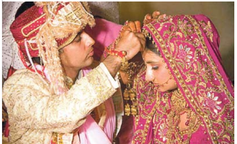
Свадебная церемония в Индии

В конечном счете, в индийской культуре сущность семейных взаимоотношений предопределяют религиозные ценности. Вот как она сформулирована в Упанишадах: