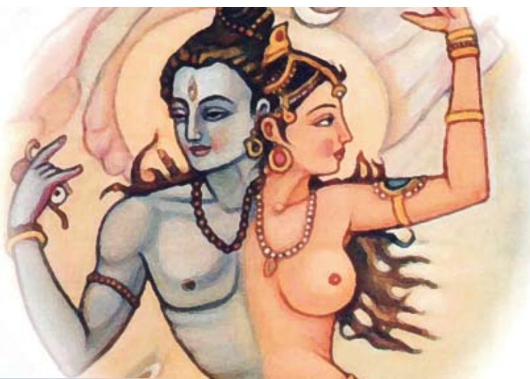
Символическое изображение энергий Инь и Ян

достаточно емко выразил В.В. Малявин. Он отмечает, что духовное развитие не противопоставлялось сексуальным переживаниям, ибо последние как раз и знаменуют высшую точку сознания, пик чувствительности в том смысле, что требуют максимальной открытости миру, точнее иному, которое присутствует в этом мире. Китайцы принимают и ценят эротическое влечение потому, что сексуальность являет собой наиболее полное раскрытие природности в человеческой жизни. В сексе зримо актуализируется восточный идеал следования естественности.