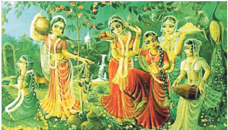
Иллюстрация из книги «Кришна благословляет жен брахманов»

профессионально-культурный характер. Так, в «Ригведе» повествуется о том, что из уст первочеловека Пуруши появились жрецы-брахманы, из его рук – воины-кшатрии, из бедер – вайшьи (земледельцы и скотоводы), из ступней – шудры (слуги). Первые три варны считались высшими. Именно они аккумулировали наиболее значимые духовные и социальные достижения. Самой стабильной, сплоченной, консолидированной была каста брахманов. В каждой стратифицированной группе царил равенство, она управлялась выборными руководителями. Касту объединяло сильное чувство солидарности, взаимопомощи, поддержки. Словно в единой семье здесь помогали нуждающимся, проявляли заботу о сиротах. Исключение из касты было величайшей трагедией. В то же время задача каждой иерархической группы заключалась в том, чтобы укреплять общенациональную связь, обеспечивая гармоничное единство общества в целом.