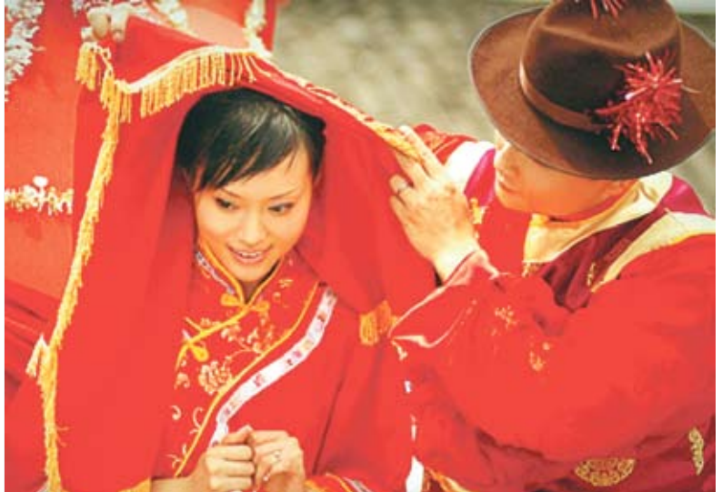
Невеста в Китае

составлял 15–17 лет, в семье супруга она становилась служанкой, работницей. Кроме того, замужество фактически означало бесповоротный разрыв с родным домом. Жена не имела права на ревность, никого не заботило развитие ее индивидуальности. От добропорядочной жены требовалось быть