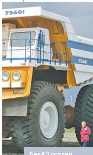
БелАЗ создал опытный образец карьерного самосвала грузоподъемностью 360 тонн. Апрель 2010 года

Задачей ближайшего будущего для Беларуси является повышение качества экономического роста за счет модернизации основных фондов и экономических отношений. Одна из важнейших целей проводи-