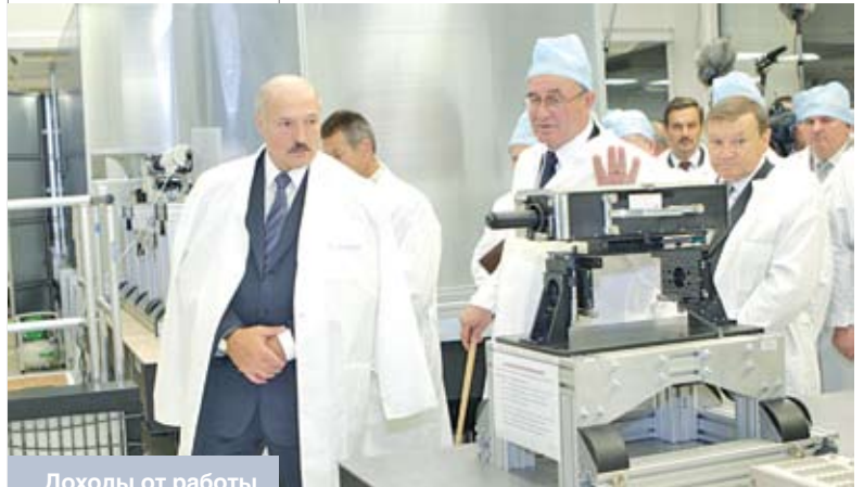
Доходы от работы предприятий космической отрасли Беларуси в перспективе должны достичь 1 млрд. долларов. Об этом заявил Президент Беларуси Александр Лукашенко во время посещения ОАО «Пеленг». Июль 2010 года

выполнения программы стенд-бай МВФ по ужесточению денежно-кредитной политики, что снизило ресурсную базу текущего года. С другой – в прошлом году нам удалось, в отличие от большинства стран СНГ, сохранить положительную динамику инвестирования в экономику, поэтому в текущем году для нас срабатывает эффект статистической базы. Но, наверное, главная причина в том, что кризис и связанная с ним ситуация с реализацией белорусской продукции на внешних рынках