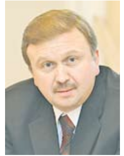
Андрей КОБЯКОВ, заместитель Премьер-министра Республики Беларусь

Рост деловой активности в мире в посткризисный восстановительный период ощущается на результатах внешнеэкономической деятельности нашей страны. Так, темп роста объема внешней торговли товарами и услугами за семь месяцев составил 118,5 %, в том числе экспорта – 122,2 %, импорта – 115,6 %. Вместе с тем негативное влияние на параметры внешней торговли Беларуси в 2010 году оказывает введение Российской Федерацией полных экспортных пошлин на нефть и нефтепродукты. В результате мы вынуждены приостановить экспорт нефти, а также существенно снизить поставки на внешние рынки нефтепродуктов.