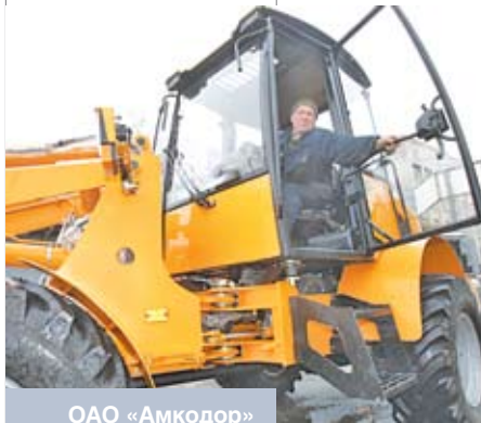
ОАО «Амкорд» за январь – июль 2010 года увеличило экспорт техники почти в три раза по сравнению с аналогичным периодом прошлого года

В целом инвестиционная политика рассматривается нами как стратегический