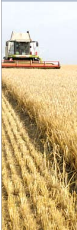
Уборка ячменя в СПК «Свислочь» (Гродненский район)

Добавлю, что в соответствии с поручением Президента Республики Беларусь правительством разработана и утверждена пошаговая стратегия увеличения не менее чем на 200 % к 2015 году доли наукоемкой и высокотехнологичной продукции в общем объеме белорусского экспорта. В результате принимаемых и намеченных к реализации мер Беларусь к 2015 году должна войти в число инновационно развитых стран.