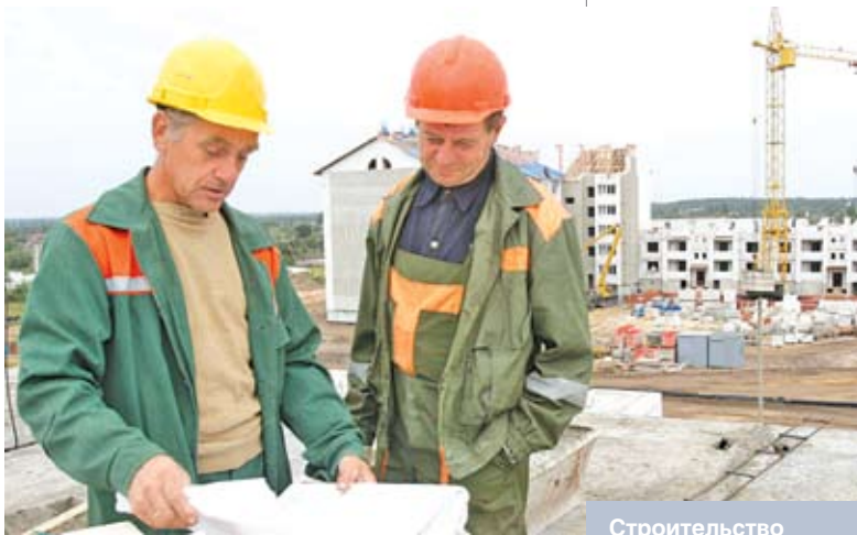
Строительство жилья в г.п. Лельчицы Гомельской области

– 2010 год стал весьма непростым для белорусско-российских отношений. Вместе с тем Российская Федерация по-прежнему остается для нас приоритетным торгово-экономическим партнером. На ее долю по итогам 7 месяцев 2010 года приходится 47,8 %