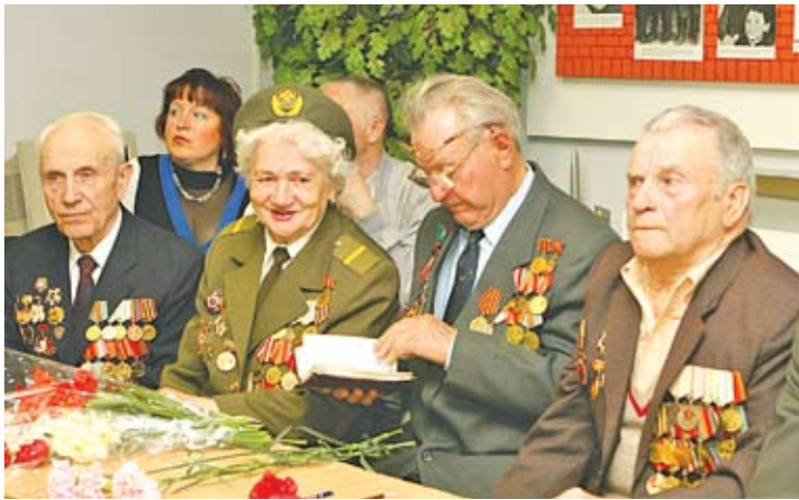
Збор «Батальёна беларускіх арлянят» у Мінску, май 2009 года