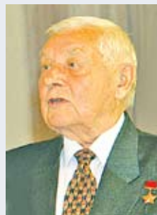
Віктар Ільіч ЛІВЕНЦАЎ, Герой Савецкага Саюза, камандзір «Батальёна беларускіх арлянят»

Член Саюза журналістаў Рэспублікі Беларусь.