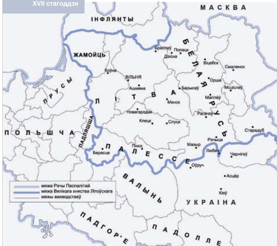
Белая Русь у другой палове XVII стагоддзя

Вышэйсказанае ў нашмат большай ступені датычыць беларусаў, якія жывуць літаральна на мяжы еўрапейскага Захаду. Нікуды нам ад гэтага не дзецца. Не будзем забываць, што да адной з намі цывілізацыі належыць Украіна. Менавіта ўкраін-