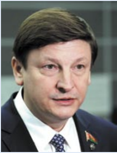
Ігар МАРЗАЛЮК, старшыня Пастаяннай камісіі Палаты прадстаўнікоў Нацыянальнага сходу Рэспублікі Беларусь па адукацыі, культуры і навуцы, член-карэспандэнт Нацыянальнай акадэміі навук, доктар гістарычных навук, прафесар:

Союз строится на принципах равноправия. Других принципов быть не может – не важно, большая страна, малая. Мы не претендуем на богатство России – свое