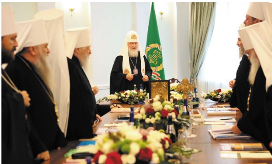
Заседание Священного синода Русской православной церкви. Минск, 2018 год

митрополит Онуфрий (предстоятель Украинской православной церкви) отказался встречаться с экзархами, а Синод УПЦ попросил их покинуть Украину [18]. Однако через месяц Синод Вселенского патриархата, состоявшийся 9–11 октября в Стамбуле, принял еще более конфликтные решения. Так, была «восстановлена» ставропигия Константинополя в Киеве и отменено решение XVII века, предоставлявшее Московскому патриарху право рукополагать Киевского митрополита. Здесь следует отметить, что существуют два различных толкования решения 1686 года. Константинополь утверждает, что оно носило временный характер, в то время как Москва считает, что Киевская митрополия была передана Московскому патриархату на постоянной основе. В любом случае Вселенский патриархат более двух столетий не оспаривал юрисдикцию Москвы над Киевской митрополией. Первые упоминания о «временной» передаче были сделаны в 1924 году в Томосе о предоставлении автокефалии Польской православной церкви. Нельзя также не отметить, что в 1686 году Киевская митрополия не была равна нынешней Украине.