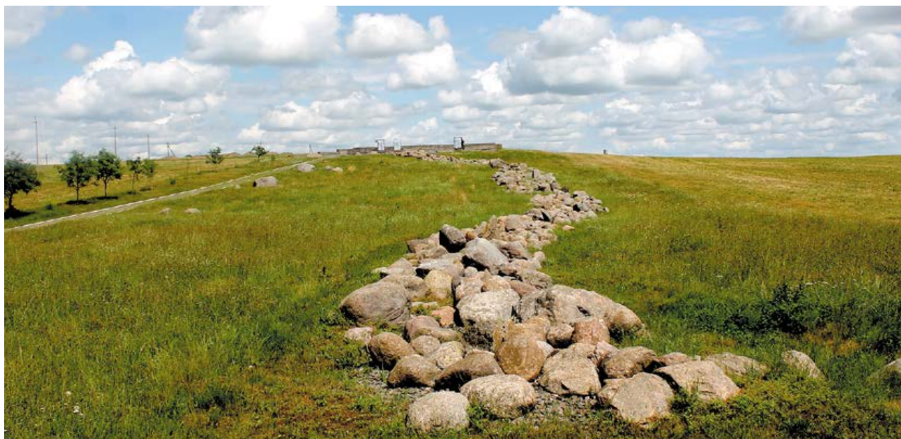
Памятник на месте массового расстрела в окрестностях Городеи

– Уничтожение мирного населения Несвижа во время оккупации – это достоверно установленный факт, – заявил он. – За истекший период расследования по уголовному делу проделан значительный объем работы. Допрошено 110 свидетелей, в том числе из категории узников концентрационных лагерей, ветеранов и участников Великой Отечественной войны, иных лиц. Проведено 20 осмотров мест происшествий, 12 осмотров документов.