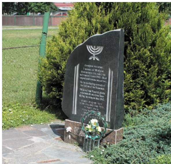
Памятник на месте Несвижского гетто