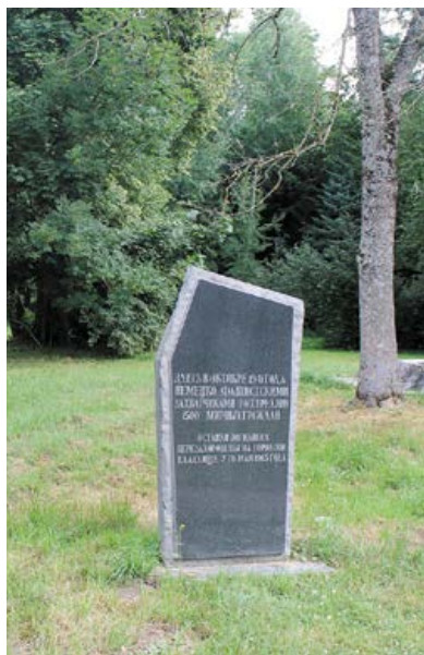
Памятник на месте массового расстрела в Старом парке в окрестностях Несвижского замка