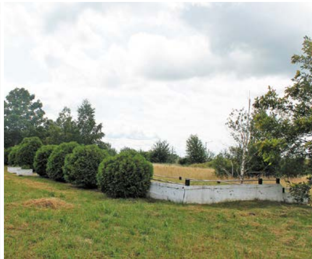
Место массового расстрела и захоронения узников гетто на Сновской дороге на окраине Несвижа

и решение о тотальном уничтожении евреев – Холокосте.