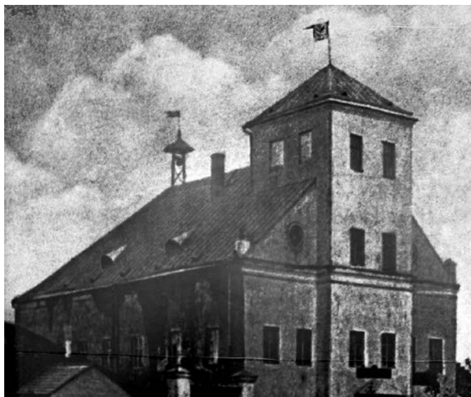
Несвижская синагога. Конец XIX века