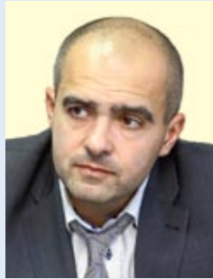
Олег ГАЙДУКЕВИЧ, первый заместитель председателя Либерально- демократической партии Беларуси:

– Я поддерживаю высказанную Президентом мысль о том, что белорусский парламент должен совершенствоваться. Никто не говорит о радикальных переменах, но надо углубленно работать по внешней политике, особенно со странами ЕС, с США. После парламентских выборов депутаты должны сделать так, чтобы наша страна наладила еще больше политических и экономических взаимоотношений в ЕС. Это задача не только МИД, но и парламента.