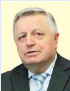
Владимир ГАРКУН, первый заместитель председателя Исполнительного комитета – исполнительного секретаря СНГ:

– В своем Послании белорусскому народу и Национальному собранию Республики Беларусь Президент Александр Лукашенко подчеркнул, что не существует большей ценности, чем мир и безопасность. Я абсолютно солидарен с главой государства: сегодня нам в первую очередь надо ценить стабильность и мир. Бывая в разных странах, вижу, как ценится спокойствие и благополучие там, где они отсутствуют. В Беларуси, слава богу, люди живут мирно. Уверен, что так будет и дальше. И, безусловно, стабильная обстановка в стране способствует заключению долгосрочных экономических контрактов.