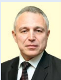
Михаил ОРДА, председатель Федерации профсоюзов Беларуси:

– Ежегодное Послание Президента белорусскому народу и Национальному собранию позволяет определить наиболее актуальные на данный момент точки развития для всего общества. В нынешнем были озвучены все волнующие людей вопросы. Это реальный, идущий от жизни взгляд на общую ситуацию в стране.