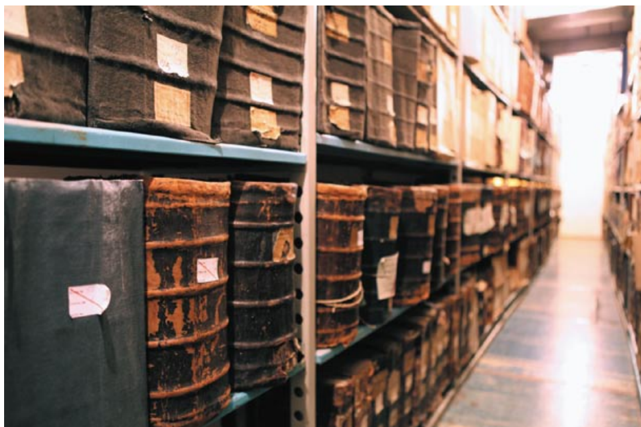
У сховішчах архіва – «наша з вамі гісторыя», як кажуць тут

Аўтар гэтых радкоў яшчэ ў далёкія 1980-я хацеў даведацца пра месца пахавання свайго дзеда, які загінуў пры вызваленні Польшчы. На шматлікія звароты ў розныя