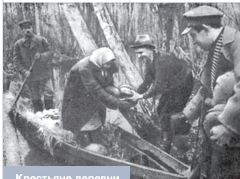
Крестьяне деревни Печище привезли партизанам хлеб. Ганцевичский район, 1943 год

Особенно большие надежды возлагали оккупанты на операцию против барановичских партизан под кодовым названием «Герман», которую запланировали на лето 1943 года. Она готовилась в строгой тайне. В ней должны были принимать участие десятки тысяч солдат и офицеров эсэсовской части, у которых на вооружении были самолеты, танки, артиллерия. «Отряды уничтожать, лагеря и дзоты разрушать, продовольствие захватить, – такую задачу поставил перед эсэсовскими головорезами руководивший карательной операцией палач белорусского народа фон Готтберг. – Деревни и прочие постройки, а также мосты и посе- вы,