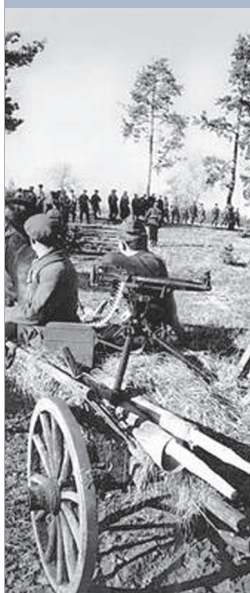
Группа партизан выходит на боевое задание. Пинская область, 1943 год