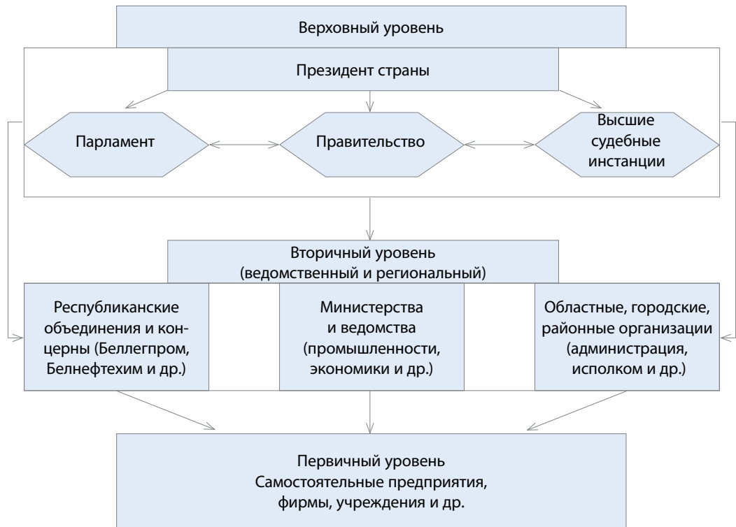
► Рисунок 1. Модель организационно-управленческой структуры современного белорусского общества

сотрудничества между государствами при акценте на сохранение самобытности различных народов, их национальных культур и суверенных государств.