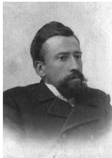
Карусь Каганец (К. Кастравіцкі) друкаваўся ў газеце «Северо-Западный край»

Дарафей Дарафеевіч Бохан (4 лютага 1878, Мінск – 1942, Тэгеран) – рускі, беларускі і літоўскі журналіст, паэт, празаік, перакладчык, літаратуразнавец, крытык, публіцыст, грамадскі дзеяч. Нарадзіўся ў Мінску, скончыў Полацкі кадэцкі корпус, потым пецярбургскае Канстанцінаўскае артылерыйскае вучылішча. У друку Д. Бо-