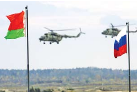
Комплексное оперативное учение Вооруженных Сил Беларуси «Осень-2008»

Вполне очевидно, что уже ряд лет Россия не имеет четкой стратегии развития отношений в рамках Союзного государства и со странами СНГ. Ее политика на данном направле-