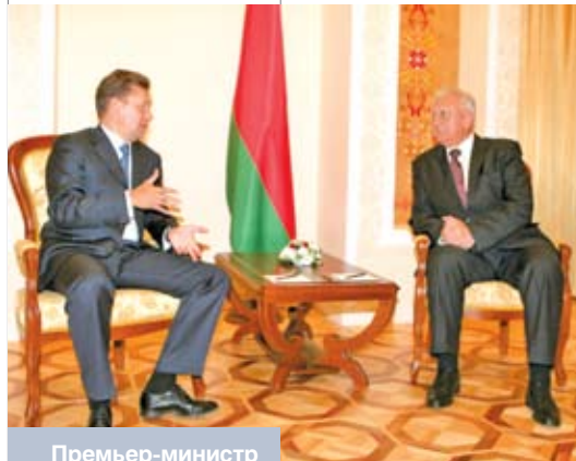
Премьер-министр Беларуси Михаил Мясникович обсуждает с председателем правления ОАО «Газпром» Алексеем Миллером цены на газ для Беларуси. 22 сентября 2011 года

и Западу дает Беларуси шанс эффективно использовать выгодное географическое положение, имеющийся индустриальный и транзитный потенциал, осуществлять сбалансированное взаимодействие со своими ближними и дальними соседями. Претворяя в повседневную действительность многовекторную внешнюю политику в современном взаимозависимом и вместе с тем противоречивом и неустойчивом мире, где существует множество конфликтов интересов и целей, Беларусь нередко сталкивается с различными препятствиями. Даже наш основ-