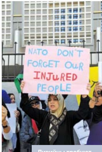
Ливийцы требуют медицинской помощи для пострадавших от бомбардировок НАТО. Сентябрь 2011 года

В ответ на такие недружественные акции, находящиеся в прямой противоречии с доктриной Европейской политики добрососедства, МИД Беларуси распространил заявление о том, что «белорусская сторона предпримет адекватные меры по защите законных интересов как своих граждан, так и предприятий». Еще более твердо позиция Беларуси в связи с принимаемыми в отношении нее санкциями сформулирована в словах Президента А.Г. Лукашенко. Во время рабочей поездки в Брестскую область он заявил: «Если нас будут дергать с точки зрения экономики, мы найдем, чем ответить. У нас немало компаний (иностранцев) работают здесь и собственность имеют, по которой мы очень больно можем ударить... Я не хочу