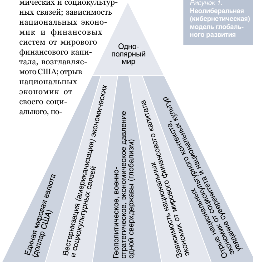
Рисунок 1. Неолиберальная (кибернетическая) модель глобального развития

литического и социокультурного контекста, увядание государственного суверенитета и национальных культур.