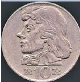
Тадеуш Костюшко. Изображение на 10 злотых Польской Народной Республики. 1960 год