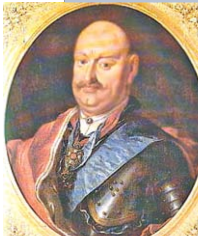
Кароль Радзивилл (Пане Коханку)

В той сече в обеих партиях было множество порубленных, наиболее тяжело – Толпыга, Дубяга и Козел; двое же от тяжелых ран сразу же умерли». Добавим, что заседание сейма проходило в костеле. Магнаты имели собственные многочисленные армии. У слущкого Иеронима Радзивилла в середине XVII века было шесть тысяч войска – столько же, сколько насчитывала вся армия ВКЛ. Эти господа позволяли себе сноситься с иностранными монархами, заключать с ними союзы, воевать на их стороне, вести войны между собой. Пан Щенявский в 1765 году объявил войну всей России из-за островов на Днепре. Почти за двести лет до этого Вишневецкие тоже начали войну с Россией, не посмотрев на то, что у короля в это время был с Россией «вечный мир», и воевали тринадцать лет. С больших панов брала пример вся шляхта, которую выросший в наших местах Фаддей Булгарин называет буйной и непросвещенной, находившейся в полной зависимости от каждого, кто кормил и поил ее. Она «поступала в самые низшие должности у панов и богатой шляхты, и терпеливо переносила побои, – с тем условием, чтобы быть битыми не на голой земле, а на ковре, презирая, однако же, из глупой гордости занятие торговлей и ремеслами, как неприличное шляхетскому званию».