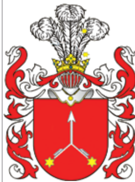
«Калинова» – родовой герб Калиновских

Кто-то скажет, что эти генералы воевали не за то, чтобы существовала Беларусь.