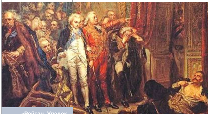
«Рейтан. Упадок Польши (Польский сейм 21 апреля 1773 года)». Фрагмент картины Яна Матейко. 1866 год. В центре в красном кафтане с поднятой рукой – Адам Понинский

Был и Адам Понинский – вор, аферист, циничный предатель, который, являясь подскарбием самого короля Станислава Августа, «грабил государство сотнями способов, собирал дань и взятки и продавал все – ордена, должности, военные звания, все, что кто-то мог купить», а также «без