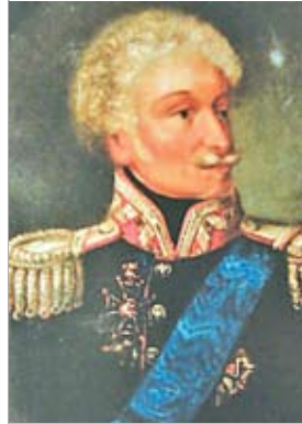
Генерал Иосиф Зайончек

Интересной, получается, была та Российская империя. Особенно если вспомнить, что буквально через какой-то десяток с небольшим лет после разделов Речи Посполитой ее видный сановник князь Адам Чарторыйский стал министром иностранных дел Российской империи и