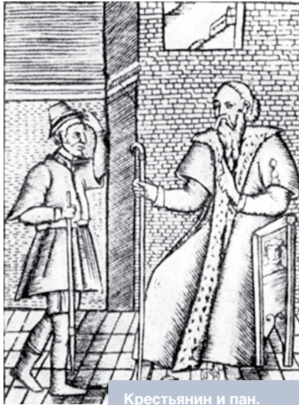
Крестьянин и пан. Гравюра XVI века

Так, может, не стоит нашим историкам уподобляться страусу и когда речь идет о пакте Риббентропа – Молотова, по которому, как продолжают утверждать за Бугом,