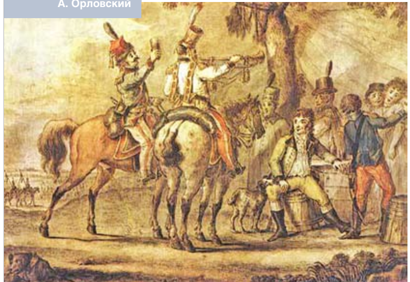
«Польские солдаты в 1794 году на биваке». Художник А. Орловский