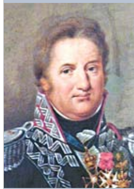
Генерал Ян Генрик Домбровский