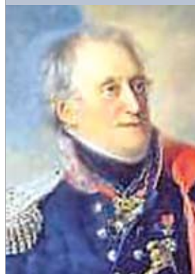
Генерал Кароль Князевич