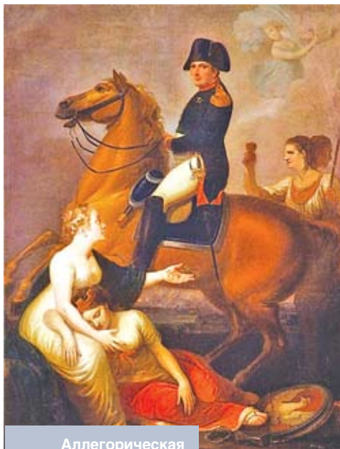
Аллегорическая картина польского художника Ю. Пешки «Наполеон и Польша»

Ничего подобного по отношению к Костюшко российские императоры не допускали даже после того, как в 1812 году