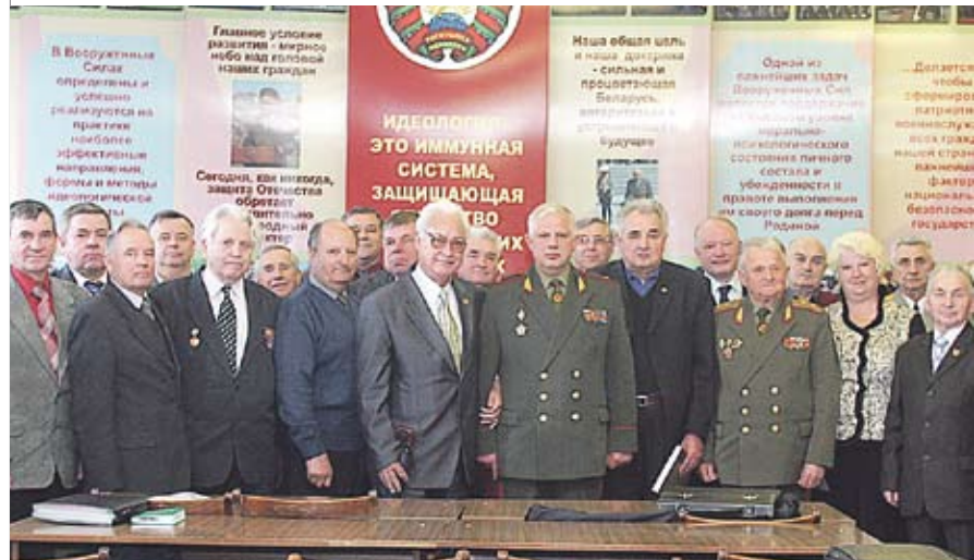
Участники заседания Республиканского совета общественного объединения «Белорусский союз офицеров»

не конкретизированы ее направления, как это уже давно сделано в государственных органах системы обеспечения безопасности и органах прокуратуры. Значительно разнятся и критерии определения эффективности идеологической работы.