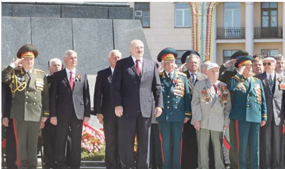
Президент Республики Беларусь А. Лукашенко на праздничных мероприятиях по случаю Дня Победы

русь А.Г. Лукашенко в докладе на постоянно действующем семинаре руководителей работников республиканских и местных государственных органов 27 марта 2003 года сравнил идеологию с иммунной системой государства, защищающей от внешних и внутренних угроз: «Государство без идеологии, как и человек без мысли, не может жить и развиваться, тем более противостоять внутренним и внешним угрозам. Идеология для государства – то же самое, что иммунная система для живого организма. Если иммунитет ослабевает, любая, даже самая незначительная инфекция становится смертельной. Точно так же с государством: когда разрушается идеологическая основа общества, его гибель становится только делом времени, как бы внешне государство ни казалось сильным и грозным» [3, с. 5].