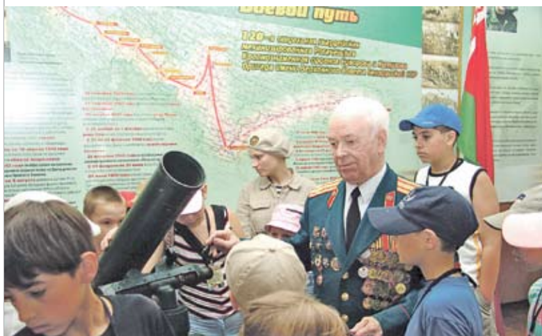
Встреча со школьниками в ходе ежегодной акции «Наследники Победы»

Но наиболее опасно, на наш взгляд, распространение идеологии экстремизма и сепаратизма [7, см. 29]. Раскол общества и зарождение конфликта внутри страны, причем не только на политической, но и на национальной и религиозной почве, – одно из основных условий для осуществления так называемых «цветных революций» или вооруженного вмешательства извне во внутренние дела суверенных государств. Примеры тому – известные события в Югославии, Ираке, Ливии, Сирии.