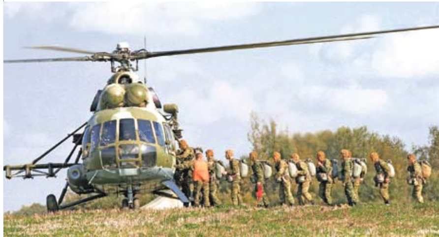
Боевая подготовка сил специальных операций Вооруженных Сил Республики Беларусь

В 2010 году по поручению Президента была подготовлена новая редакция Концепции национальной безопасности Беларуси, утвержденная его Указом № 575 от 9 ноября 2010 года [7]. «Для устойчивого развития нашего государства это один из наиболее значимых документов, – отметил в ходе заседания Совета Безопасности Республики