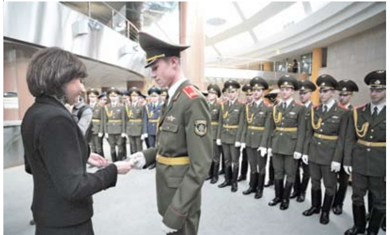
Торжественное вручение членских билетов БРСМ

войны прочно вошла в инструментарий внутренних деструктивных сил и направлена прежде всего на попытки раскола общества, изменение мировоззрения граждан, дискредитацию символов Великой Победы, возвращенных белорусскому народу по результатам референдума 14 мая 1995 года, подрыв доверия к власти и основным государственным институтам.