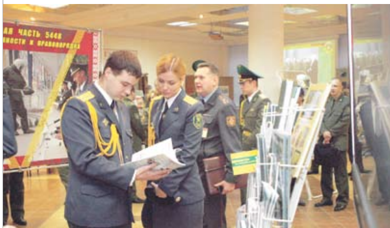
Межведомственная научно-практическая конференция «Инновации как путь повышения эффективности идеологической работы». Ноябрь, 2011 год

но содержание, структура и объем социально-гуманитарных дисциплин в учреждениях высшего образования. В итоге значительно сокращено количество аудиторных часов на преподавание социально-гуманитарных дисциплин, что может негативно проявиться уже в ближайшем будущем. Например, для командных и инженерных специальностей в военных учебных заведениях в два раза сокращен объем дисциплин «Политология» и «История», исключены такие дисциплины, как «Социология» и «Основы психологии и педагогики». Но ведь каждый офицер – это, прежде всего, педагог. За год-полтора из необученного солдата срочной службы он должен подготовить военного специалиста: обучить необходимой военно-учетной специальности, дать прочные навыки работы со сложной военной и специальной техникой, воспитать из него настоящего патриота – защитника Отечества. Возможно ли это без знания даже основ психологии и педагогики? Становится невозможным выполнение важнейшего принципа – учить войска тому, что