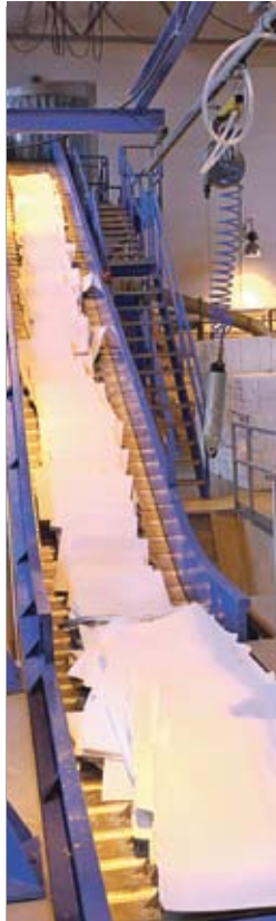
ОАО «Бумажная фабрика «Спартак»

Уже в Советском Союзе стало окончательно очевидно, что простое наращивание объемов производства не обеспечивает роста народно-хозяйственной эффективности. Первым этапом на пути отказа от объемных показателей стало использование в качестве важнейшего критерия оценки показателя прибыли (выручка за вычетом материальных затрат, заработной платы и амортизации) и рентабельности. В ходе реформы резко повы-