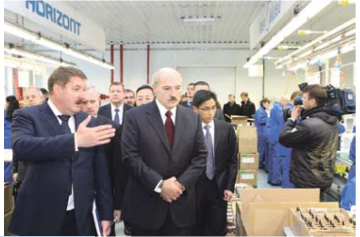
Президент Беларуси Александр Лукашенко во время посещения СООО «Мидеа-Горизонт»

Смысл не в том, чтобы интересы и цели государства совпадали непосредственно с устремлениями финансового менеджмента на предприятии. Необходимо и достаточно, чтобы связь между интересами микро- и макроуровней обозначалась, отслеживалась, подвергалась анализу, регулировалась. Важ-