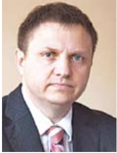
Александр ЧЕРВЯКОВ, директор НИЭИ Министерства экономики Республики Беларусь