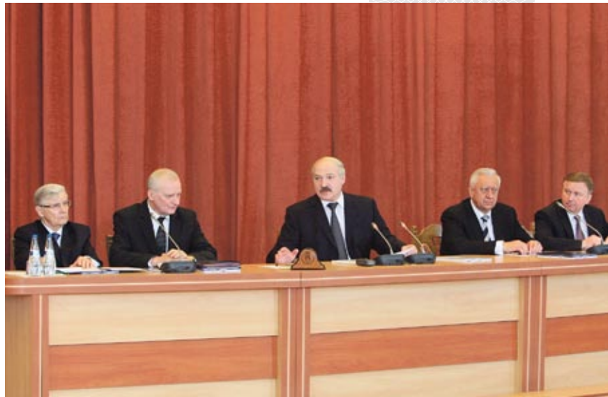
▲ Прэзідэнт А.Р. Лукашэнка ў час нарады з вядучымі навукоўцамі па пытанні перспектывы развіцця навукі. НАН Беларусі, 31 сакавіка 2014 года

Менавіта на гэтую важную праблему звярнуў увагу Прэзідэнт краіны А.Р. Лу- кашэнка, калі выступаў на нарадзе пе- рад вядучымі навукоўцамі ў Нацыяналь- най акадэміі навук Беларусі 31 сакавіка 2014 года. Кіраўнік дзяржавы падкрэсліў, што гуманітарныя навукі – гэта, перш за ўсё, навукі ідэалагічныя. Сёння настаў час абагульніць вопыт існавання суверэн- най Беларусі, вылучыць, сістэматызаваць і выкарыстоўваць у ідэалагічнай працы ўсё тое, што дапаможа кансалідацыі гра- мадства і ўмацаванню адзінства нацыі, Гуманітарныя навукі павінны служыць ідэйным падмуркам грамадска-палітыч- нага развіцця краіны, з'яўляцца важным інструментарыем распрацоўкі абгрунта- ванай стратэгіі дзяржаўнага кіравання, якая адпавядае сучасным патрабаванням і будзе садзейнічаць кансалідацыі людзей на аснове вывучэння і папулярнага