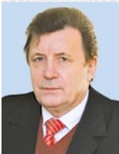
Аляксандр КАВАЛЕНЯ, доктар гістарычных навук, прафесар

Адкрыццё 15 кастрычніка 1929 года Інстытута гісторыі Беларускай акадэміі навук з'явілася важнай грамадска-палітычнай і навукова-культурнай падзеяй у жыцці беларускага грамадства. Гэты арыгінальны і аўтарытэтны навуковы цэнтр быў заснаваны дзякуючы нацыянальнай свядомасці грамадска-палітычных дзеячаў і таленавітай пляядзе айчынных вучоных-гісторыкаў, якімі ганарыцца беларускі народ.