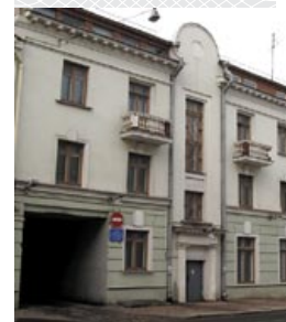
Здание бывшей товарной биржи в Минске (теперь дом 10 по ул. Володарского)