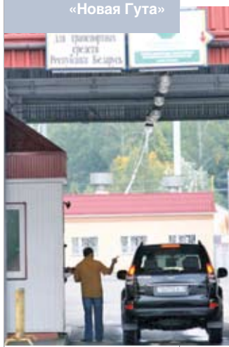
Таможенный досмотр на погранпереходе «Новая Гута»

По словам жителей Минска, этой весной не наблюдалось нехватки, как пишут на Западе, продуктов на полках магазинов. Затруднения вызывали, скорее, рост цен, нехватка иностранной валюты и накопление запасов, иногда нарушавшее цепочку поставок. Когда я была в стране в середине июня, полки были полностью забиты, в магазинах и на рынках было множество покупателей, а на бензоколонках не было очередей, о которых сообщали западные СМИ. Сейчас инфляция, по-видимому, стабилизируется. Протесты торговцев на западной границе Беларуси широко освещаются в западных СМИ, выискивающих любые признаки народных волнений. При этом они редко упоминают о том, как сильно вывоз дешевых белорусских товаров и бензина на Запад для перепродажи вредит экономике Беларуси, особенно в контексте текущих экономических трудностей. Чтобы избежать ущерба,