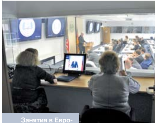
Занятия в Европейском центре по изучению проблем безопасности имени Джорджа Маршалла

о повышении помощи белорусскому гражданскому обществу на 30 % – до 15 миллионов долларов в год. В 2009 году Национальный фонд поддержки демократии выделил 2,7 миллиона долларов на белорусские «независимые» СМИ, гражданское общество (выступающее за «демократические идеи и ценности, а также за рыночную экономику»), неправительственные и политические организации. Опубликованная Wikileaks депеша (VILNIUS 000732), датированная 12 июня 2005, подтверждает факт контрабанды денег в Беларусь сотрудниками Агентства США по междуна-