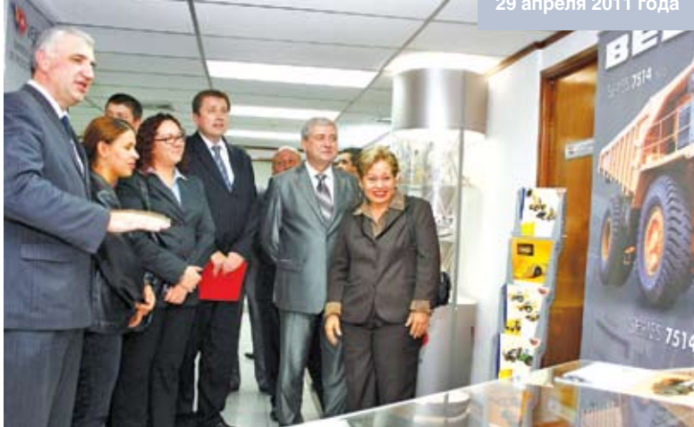
Открытие совместного белорусско-венесуэльского торгового дома в Каракасе. 29 апреля 2011 года

представляет Беларусь. Единственное, в чем он может быть прав, это в том, что успех белорусской экономической модели действительно угрожает нелиберальным догмам. Также возможно, что, с точки зрения Обамы, эта страна «угрожает» внешней политике Соединенных Штатов уже тем, что находится рядом с Россией и может оказаться в центре растущих трений между Россией и США из-за НАТО и «противоракетного щита». Если Америка сумеет посадить в Беларуси прозападное правительство, это станет важным шагом вперед в рамках ее попыток окружить Россию, которая обладает тесными военными связями с Беларусью и держит в ней собственный «противоракетный щит».