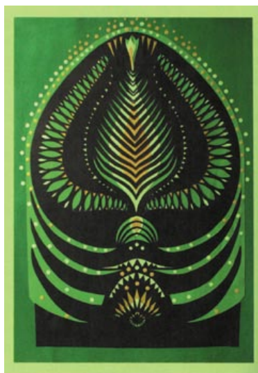
Творы Вікторыі Чырвонцавай, заснавальніцы маладзечанскай школы выцінанкі. 1990-я гады