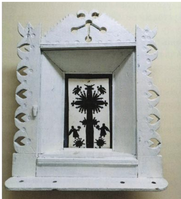
На захадзе Беларусі католікі ўпрыгожвалі выцінанкай разьбяныя алтарыкі

На Гродзеншчыне ў католікаў распраўсюдзілася традыцыя аздабляць выцінанкай хатнія алтарыкі. Праваслаўныя ўпрыгожвалі папяровымі карункамі покуць – абразы, палічкі пад імі. Паўсюль выразалі папяровыя сурвэткі пад святочныя пірагі.