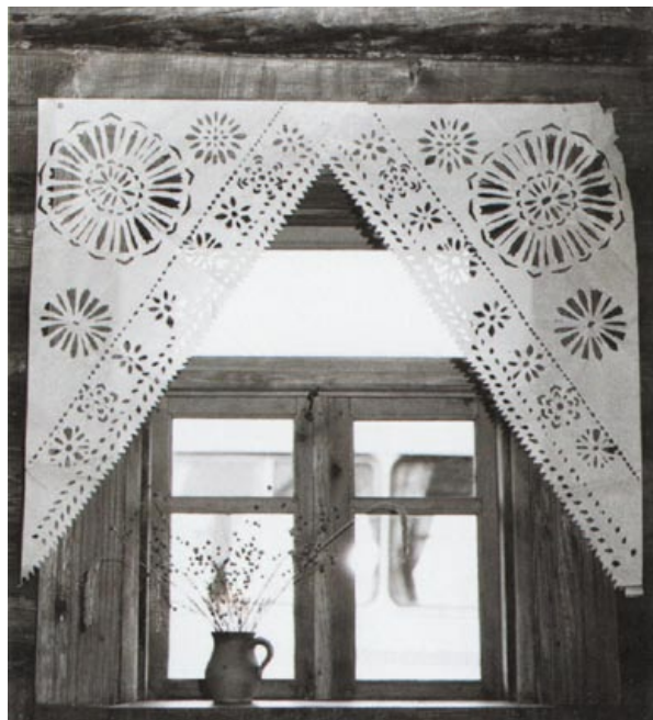
Пасля вайны ў вёсках згадалі пра папяровыя фіранкі і зноў узяліся за нажніцы

Сапраўным талентам лічылася ўменне выразаць нажом. На Навагрудчыне бытаваў характэрны мясцовы від выцінанкі – выбіванка. Узор высякалі вострым