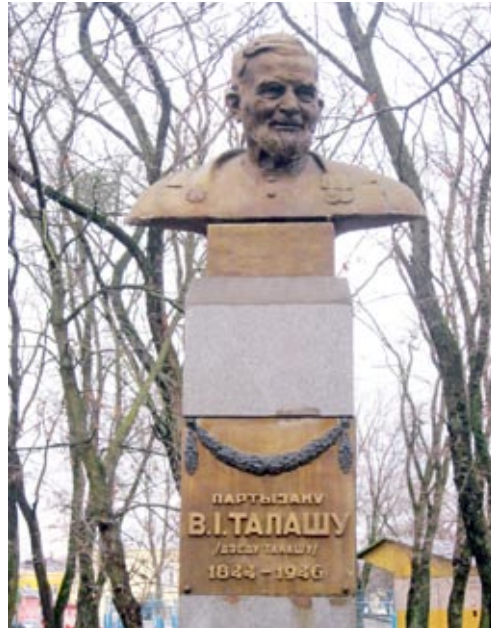
◀ Помнік В.І. Талашу ў г. Петрыкаве

Трэба адзначыць, што ў справе ўшанавання памяці пра дзед Талаша ў нас зроблена многае. Яго вобраз натхняў не толькі Якуба Коласа, легендарнаму партызану прысвяцілі свае творы некаторыя беларускія паэты, мастакі і скульптары. Абеліск работы Заіра Азгура ўстаноўлены на высокім беразе Прыпяці ў гарадскім парку Петрыкава, на магіле героя, якая знаходзіцца на тамтэйшых могілках, таксама ўсталяваны помнік. На сталічнай плошчы Якуба Коласа