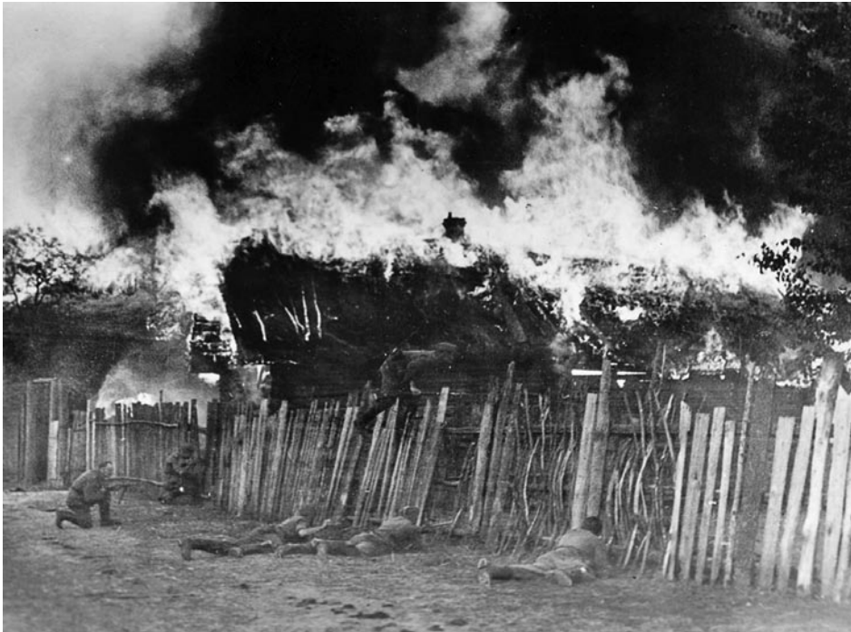
Во время операции «Котбус» применялась тактика выжженной земли. 1943 год

яме было обнаружено впоследствии 460 тел убитых мирных жителей.