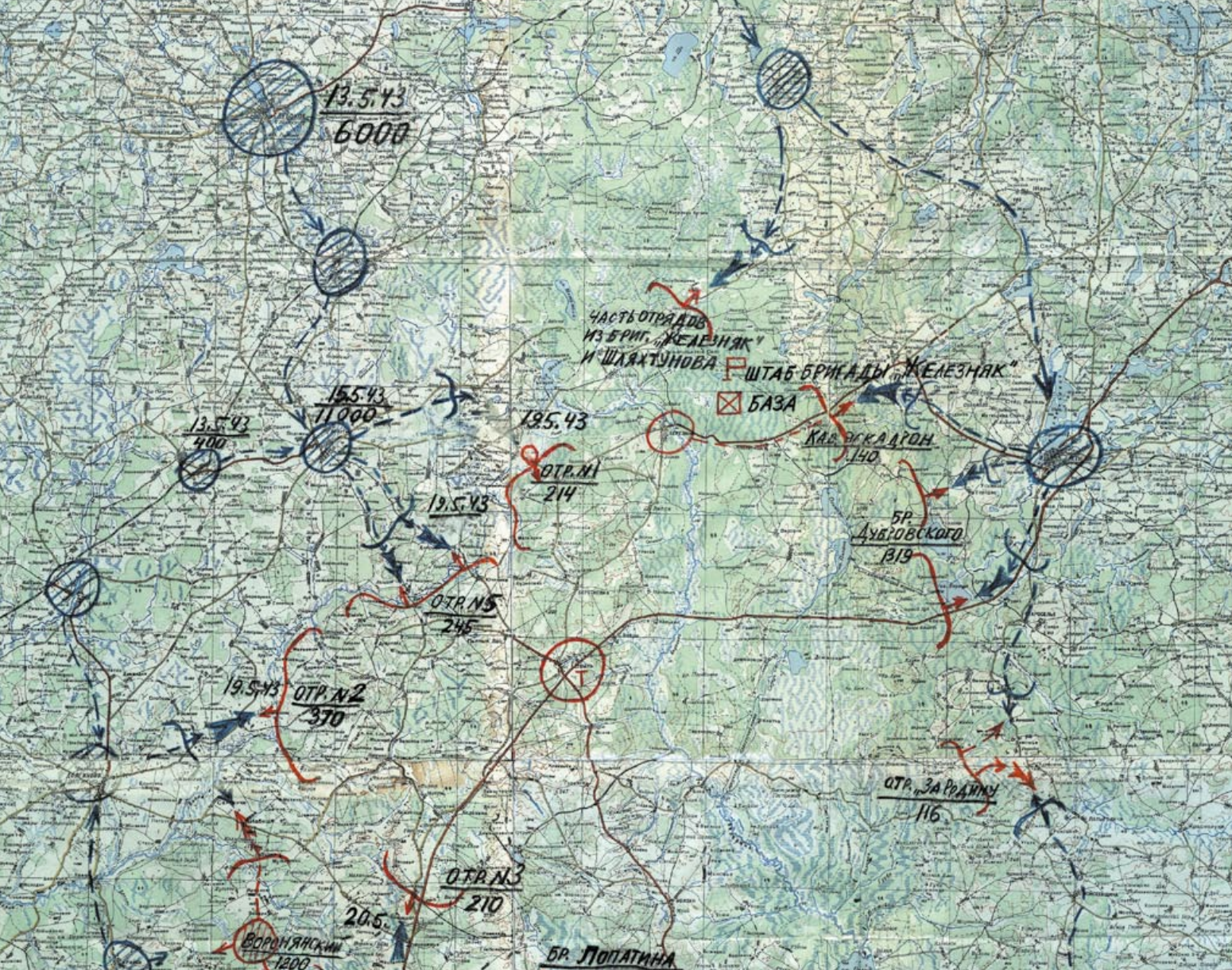
Карта боевых действий во время операции «Котбус». 1943 год

Весной 1943 года партизаны Беларуси, нанося фашистам существенный урон, отвлекали их от действий на фронте. Напомним хронологию военных событий: в апреле 1943 года по приказу Гитлера разрабатывается операция «Цитадель» по окружению советских войск, обороняющих так называемый Курский выступ. Сходящийся удар планировалось нанести со стороны Орла и Белгорода. Ставка Верховного Главнокомандования СССР знала о планах неприятеля и со своей стороны готовила мощное контрнаступление. События лета 1943-го войдут в учебники под названием Курской битвы и будут признаны крупнейшим танковым сражением в истории.