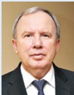
Василий ЖАРКО – министр здравоохранения Республики Беларусь:

– Важным результатом для системы здравоохранения стало достижение Беларусью целей тысячелетия: сокращение детской смертности, улучшение охраны материнства, борьба с ВИЧ/СПИД, малярией, туберкулезом. Наша страна практически приблизилась к смыканию «демографических ножниц». Важным результатом работы также стало уменьшение числа умерших от болезней, вносящих основной вклад в общую смертность населения: от внешних причин, болезней органов пищеварения, дыхания. Удалось стабилизировать число случаев смерти от новообразований. Достигнуто снижение числа умерших от болезней системы кровообращения в трудоспособном возрасте. В течение нескольких лет в Беларуси сохраняются стабильно низкие уровни показателей младенческой смертности, смертности детей в возрасте до 5 лет, показателя материнской смертности.